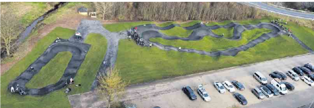
Ein Blick aus der Luft zeigt beeindruckend die Pumptrack-Anlage in Weilerswist.

Das Pumptrack ist seither ein beliebter Treffpunkt für Groß und Klein. Neben der Hauptstrecke wurde ein spezieller Kids-Pumptrack eingerichtet, der auch den