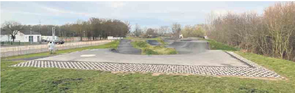
Rund um die Startrampe wurden Rasengitter verlegt, um den Boden zu stabilisieren.

In diesem Jahr werden vier Bänke an der Pumptrack-Anlage aufgestellt. Diese finanziert das Kinder- und Jugendparlament aus seinem eigenen Budget sowie aus Spenden des Dorfverschönerungsvereins und der Kreissparkasse Euskirchen.