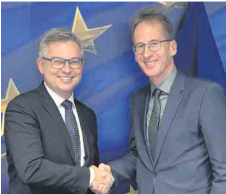
Bei EU-Kommissar Magnus Brunner warb EU-Obmann Detlef Seif kürzlich für den dringend erforderlichen Politikwechsel in der Asylpolitik.

Sport hat für den Familienvater einen festen Platz. In seiner Freizeit hält er sich mit Joggen und Radfahren fit