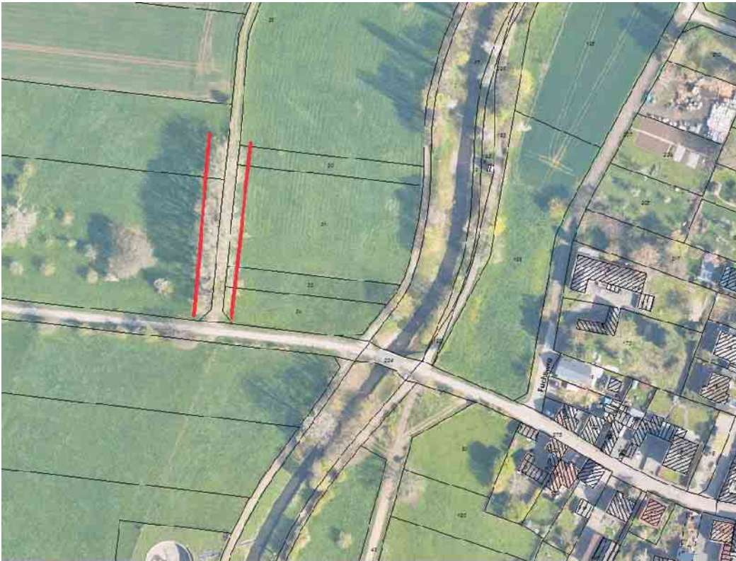
Hier ist der Arbeitsbereich des Fällkrans am Fußgängerweg bei Hausweiler eingezeichnet.

Am Donnerstag und Freitag wird ein Fällkran in Hausweiler an einem wieder hergestellten Fußweg die durch Trockenheit und Fäule angegriffen Pappeln stark einkürzen. Diese Maßnahme ist zur Wiederherstellung der Verkehrssicherheit unabdingbar und wird uns in naher Zukunft überall dort unten beschäftigen, da die Bäume in die Jahre gekommen sind. Die Bäume werden auf etwa 2 Meter gestutzt und sollen danach soweit wie möglich als Kopfbaum umerzogen werden, um sie langfristig für den Naturhaushalt zu erhalten. Dies ist so mit der Unteren Naturschutzbehörde des Kreises Euskirchen abgestimmt worden. Der Landwirt sowie der Ortsbürgermeister Bert Henn wurden ebenfalls von Christoph Zimmermann vom Grünflächenamt der Gemeinde Weilerswist darüber informiert. Die Bäume sehen von außen noch gut aus, sind aber innerlich total verfault und haben bisweilen nur noch eine geringe Restwandstärke.