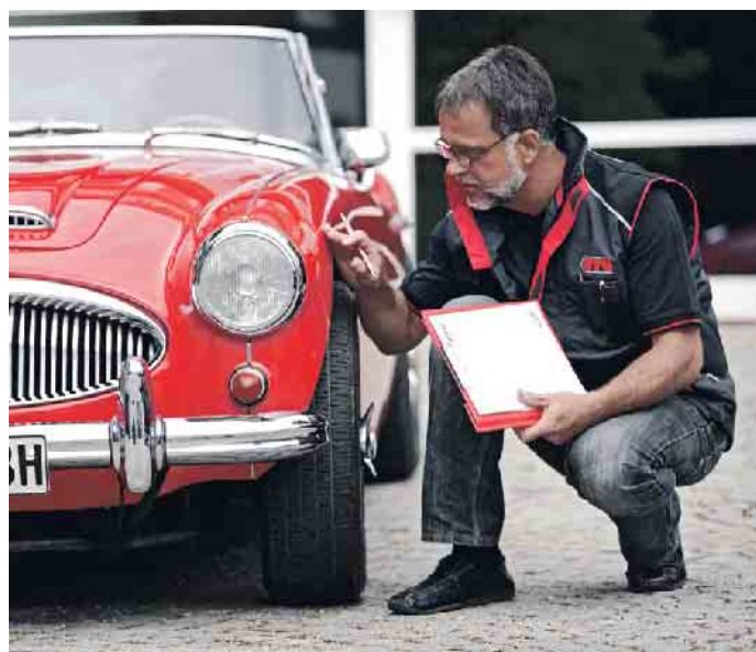
Vor der Erteilung eines H-Kennzeichens muss erst ein Ingenieur das Auto überprüfen und die Originalität beurteilen.

• Nachteile: Vor der Erteilung eines H-Kennzeichens muss erst ein Ingenieur von Dekra, TÜV, GTÜ oder KÜS das Auto überprüfen und die Originalität beurteilen. Daraus ergibt sich, ob das Auto ein erhaltenswerter Klassiker ist oder ein verbrauchter Alltagsgegen-