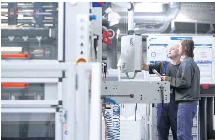
Ausbildung an hochmodernen Produktionsmaschinen in der Faltschachtel-Industrie.

Fazit: Eine Karriere in der Faltschachtel-Industrie bietet attraktive Perspektiven für alle, die an innovativen Verpackungslösungen für die Zukunft interessiert sind. (akz-o)