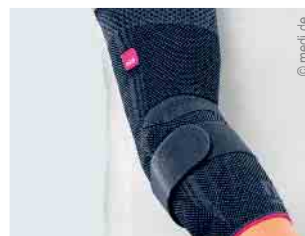
Versorgung von Ellbogen und Schulter