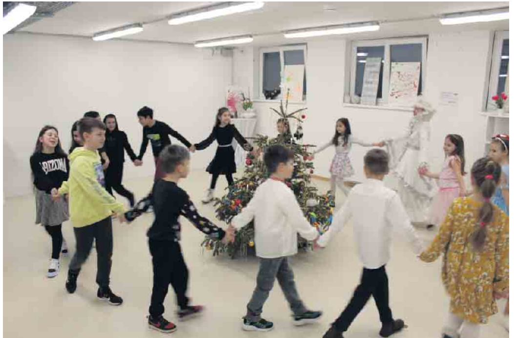
Singend tanzten die ukrainischen Kinder während der Weihnachtsfeier um den vom KJP gestifteten Weihnachtsbaum.

Die Kinder übten fleißig Gedichte, Lieder auf ukrainisch oder russisch sowie choreographische Auftritte zu ihrem Lieblingstreck von den Gewinnern der Eurovision. Damit wollten sie Väterchen Frost und seine Enkelin Snegurotschka, die auch nicht fehlen durften, um ein Geschenk bitten.