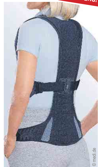
Versorgung des Rumpfs

NEU in Mechernich: Mittwochs bis 18 Uhr geöffnet und jeden 1. & 3. Samstag im Monat von 09-13 Uhr!