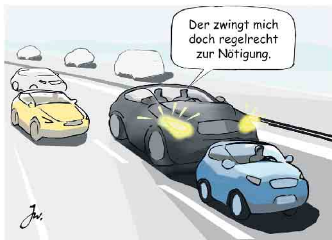
Falsche Reaktion auf Drängler: Demonstratives Langsamfahren auf dem linken Fahrbereich trägt zur Eskalation bei.

- ohne Hektik und ohne andere Autofahrer in Bedrängnis zu bringen. Ebenso gilt es zu vermeiden, die Bedrängnis, in die man durch den aufdringlichen Hintermann gebracht wird, an das vorausfahrende Fahrzeug weiterzugeben, indem man sich diesem zu sehr nähert. Denn daraus können unliebsame Kettenreaktionen resultieren. Zur Vermeidung solcher Situationen ist es ebenfalls ratsam, bei einem eigenen Überholvorgang immer wieder - alle fünf bis zehn Sekunden raten die Fachleute - zu kontrollieren, dass man nicht ein schnelleres Fahrzeug hinter sich behindert. Manche Autofahrer begehen den Fehler, wenn ein Fahrzeug mit höherer Geschwindigkeit hinter ihnen auftaucht, dessen Fahrer zu provozieren, indem sie den Überholvorgang unnötig lang ausdehnen bei möglichst geringem Tempo. Diese Verkehrsteilnehmer sollten erstens das allgemeine Rechtsfahrgebot in Deutschland nicht vergessen und sich zweitens darüber klar sein, dass sie mit ihrem Verhalten dem Eskalieren einer solchen Situation Vorschub leisten können. (mid/ak-o)