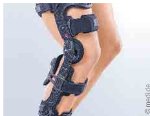
Versorgung des Kniegelenks