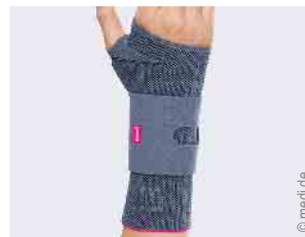
Versorgung der Hand