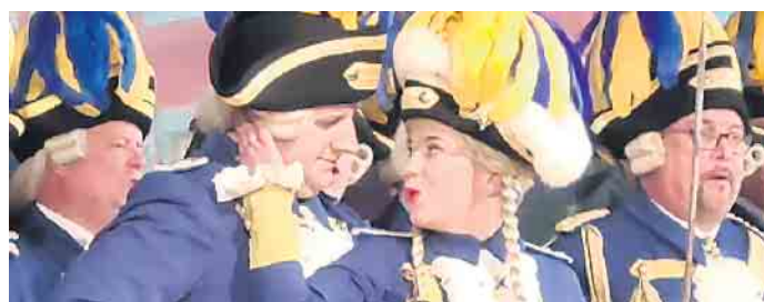
Funkemarieche und ihr Tanzmajor