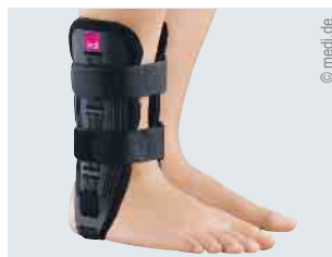
Versorgung des oberen Sprunggelenks