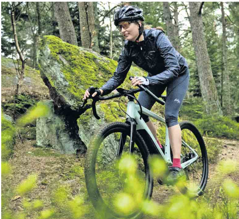
In der Freizeit lässt sich das E-Bike als Trainingsgerät noch gezielter nutzen.

Noch persönlicher wird das Training mit dem E-Bike dank der individuellen Einstellbarkeit der Fahrmodi. Die Nutzer können dabei unter anderem selbst definieren, in welchem Modus mehr körperliche Eigenleistung erbracht werden soll und an welcher Stelle und wie stark sie der Motor des E-Bikes unterstützt. Am Bordcomputer Kiox 300 lassen sich Fitnessdaten wie verbrauchte Kalorien, Kadenz und Wattzahl anzeigen. Das Gerät lässt sich flexibel am Lenker positionieren, sodass jederzeit freie Sicht auf die Daten gegeben ist. Die Bewegung zählt sich Kilometer für Kilometer aus. Denn eine Stunde mit dem E-Bike verbrennt in normaler Fahrweise durchschnittlich rund 300 Kalorien - bei sportlicher Fahrt sind es nochmals deutlich mehr. (djd)