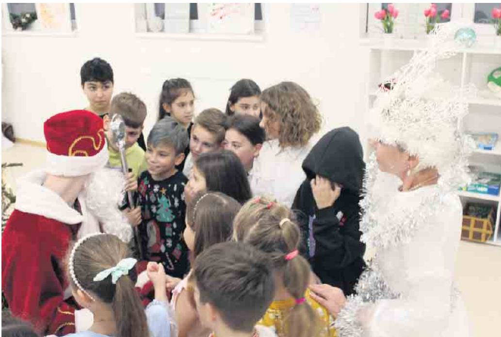
Väterchen Frost und seine Enkelin Snegurotschka durften bei dem orthodoxen Weihnachtsfest natürlich nicht fehlen.

Sollten die Kinder das nächste Weihnachtsfest immer noch in Weilerswist feiern, dann werden bestimmt schon einige deutsche Weihnachtslieder nicht fehlen, denn „Alle Jahre wieder kommt das Christkind...“ ist eine Tradition, die die Kinder aller Nationen und Länder verbindet - trotz allem, was in der Welt so passiert, egal wo wir gerade leben oder wohnen und welche Sprache wir gerade sprechen.