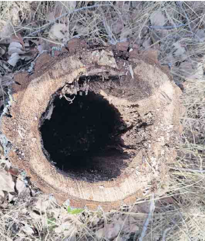
Viele Äste der Pappeln sind innen verfault und drohen wegen der geringen Restwandstärke abzubrechen.