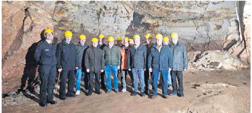
Der Besuch im Bergwerk war das Highlight des Besuchs im Bergbaumuseum Mechernich.

Nach einem gemeinsamen Mittagessen, das reichlich Gelegenheit für Gespräche und Erinnerungen an aktive Dienstzeiten bot, machte sich die Gruppe gut gelaunt mit dem Bus auf den Weg nach Mechernich. Ziel war