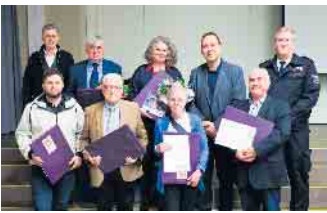
Der Rat dankt den langjährigen Kommunalpolitikerinnen und Kommunalpolitiker sowie Ehrenamtliche für ihr Engagement in der Gemeinde Weilerswist.

tragen gewesen und hätten nicht vom Land refinanziert werden können. Die Entscheidung über die mögliche Beschaffung eines zusätzlichen Rasenmähers für den Bauhof oder über alternative Lösungen zur Abdeckung von Arbeitsspitzen, beispielsweise durch Fremdvergaben, wurde vertagt und soll in der Ratssitzung im Januar 2026 erneut beraten werden. Darüber hinaus befasste sich der Rat mit mehreren satzungsrechtlichen Beschlüssen, unter anderem zur