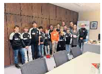
Einen Teil des Erlöses spendeten die Jugendlichen dem Jugendzentrum Weilerswist, um die Verschönerung des Billardraums zu unterstützen.

Ein herzlicher Dank gilt der C-Jugend des TuS Vernich, ihren Betreuerinnen und Betreuern, der Firma ErftGrün sowie allen Besucherinnen und Besuchern,