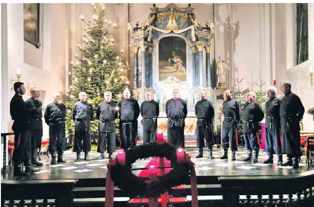
Don Kosaken Chor