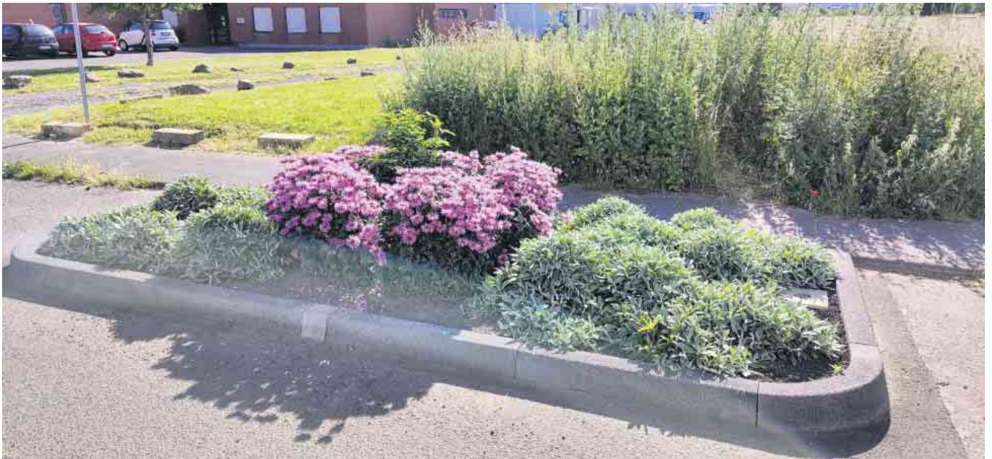
Eine „Pflanze des Jahres 2023“ erfreute im Sommer bereits die Weilerswister, unter anderem in der Martin-Luther-Straße: Die violett blühende Indianernessel der Sorte „Pummel“.

Einige sind bereits nominiert und auch schon in der Gemeinde ansässig