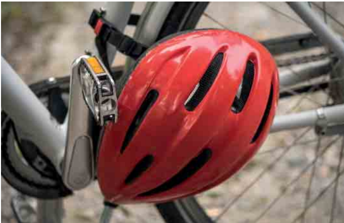
Das Tragen eines Fahrradhelms bietet Radlern den bestmöglichen Schutz.

Fast jeder zweite Fahrradfahrer in Deutschland achtet auf die persönliche Sicherheit und trägt immer (36 Prozent) oder meistens (13 Prozent) einen Helm. Heißt aber auch: Rund die Hälfte der Radfahrer trägt nie (39 Prozent) oder nur selten (zwölf Prozent) einen Fahrradhelm. Dabei ist bei einem Viertel aller Fahrradunfälle der Kopf betroffen. Fachleute empfehlen ausdrücklich das Tragen eines Helms. Die Helme werden auf verschiedene Qualitätsstandards geprüft. Neben der sicheren Bauart werden auch Grenzwerte von Weichmachern in den Kunststoffen getestet. Die Stabilität der Helme wird durch das Durchhaltevermögen bei einem Aufprall überprüft. Ein Kinderhelm muss beispielsweise einen Sturz aus 1,50 Metern aushalten. Vielen Verbrauchern ist nicht bewusst, dass Helme ihre Schutzwirkung nach einem Sturz oder längerer Gebrauchszeit verlieren. Hierauf kommt es beim Kauf an: Da Helme in verschiedenen Größen erworben werden können, sollte vor dem Kauf der Kopfum-