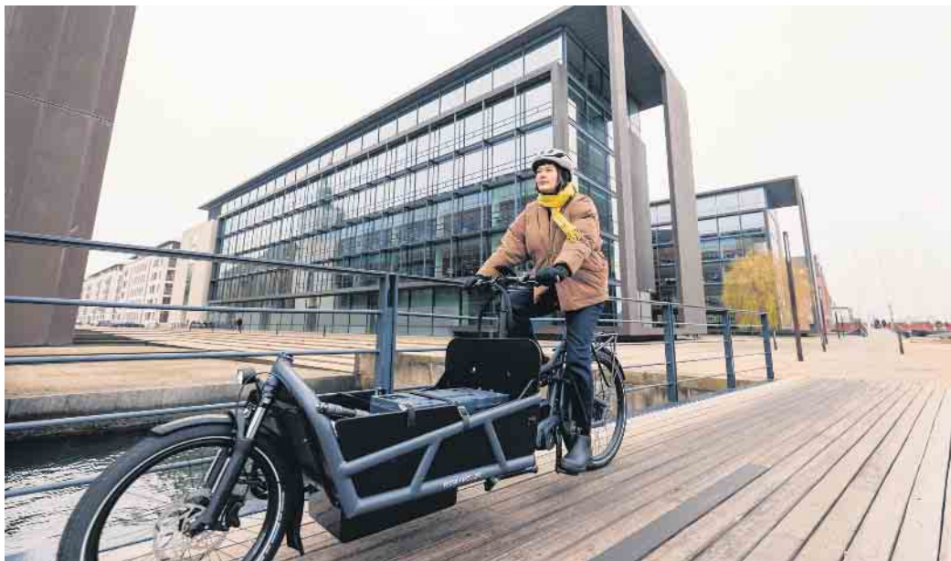
Mit dem Lastenrad lassen sich Einkäufe oder auch der Nachwuchs umweltfreundlicher und sicherer befördern.

Darauf kommt es beim Radfahren im Herbst und Winter an