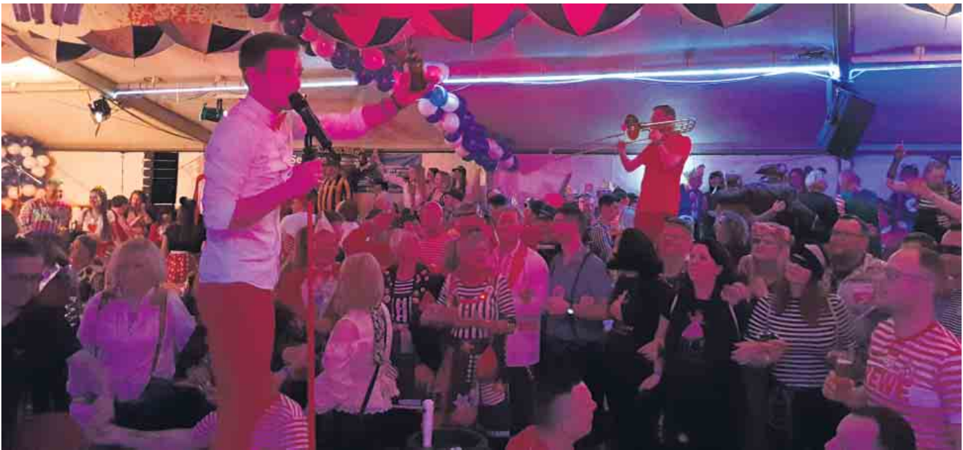
Stimmung im Festzelt

kg-metternich@outlook.de 5. Februar - Kinder-Karnevalsparty ab 11.11 Uhr 16. Februar - Weiberfastnachtsparty ab 15 Uhr 19. Februar - Karnevalszug D'r Zoch kütt Start 14 Uhr anschließend After-Zoch-Party Dreimol Mätenich Alaaf. Euer Vorstand der KG Blau-Weiß Metternich 1956