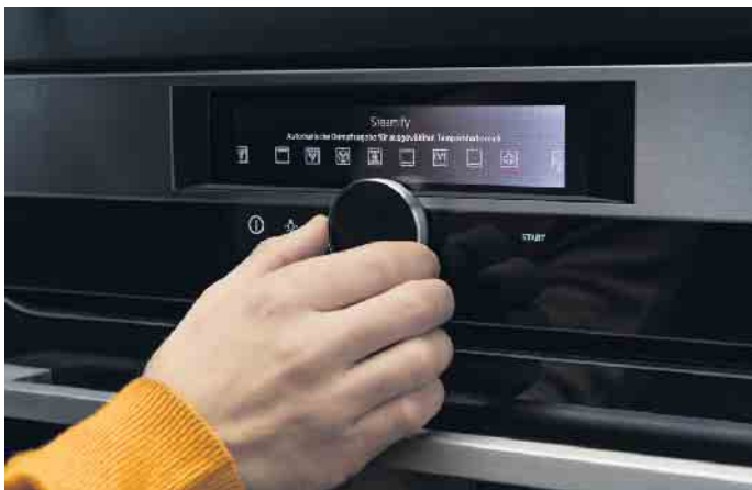
Sous-Vide-Garen wie ein Professional, Braten und Backen mit Steam-Technologie: Einfach die gewünschte Temperatur auswählen. Der Backofen fügt dann ganz automatisch die richtige Dampfmenge hinzu.

„Wie man zu seiner ganz persönlichen, optimalen Lösung kommt, dabei unterstützen die Expertinnen und Experten in Küchenstudios, Küchenfachgeschäften und Möbelhäusern mit Küchenfachabteilungen“, so Volker Irle, Geschäftsführer der AMK - Arbeitsgemeinschaft Die Moderne Küche e.V. Denn das Angebot an attraktiven, innovativen und mit allem erdenklichen Komfort ausgestatteten Einbau-Backöfen & Einbau-Herden ist sehr groß. Es beginnt beispielsweise mit den individuellen Ess- und Kochgewohnheiten sowie der Anzahl der im Haushalt lebenden Personen. Und der Größe der (Wohn)Küche, um abzuklären, ob der neue Backofen mit weiteren Einbaugeräten kombiniert werden soll. „Hier bieten sich interessante Geräte-Ensembles in einem perfekt aufeinander abgestimmten Design an“, erläutert AMK-Chef Volker Irle. Das kann ein 60 cm hoher Backofen zusammen mit einem weiteren 60er-Einbaugerät sein (z. B. einem Dampfgarer). Je nach Platzangebot und den persönlichen Vorlieben sollen vielleicht mehrere Einbaugeräte neben- oder übereinander integriert werden wie beispielsweise ein Multifunktionsbackofen zusammen mit einem Kompakt-Mikrowellengerät und Kompakt-Kaffeefullautomaten plus Wärmeschublade. „Das ermöglicht noch mehr Flexibilität und Vielfalt bei der Essenszubereitung.