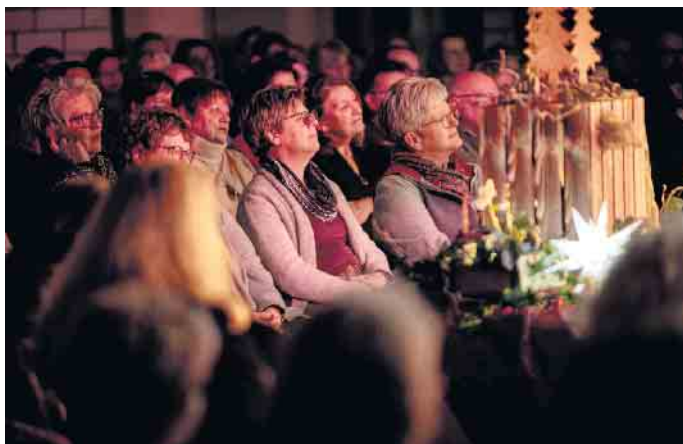
190 Gäste lauschten den weihnachtlichen Vorträgen.