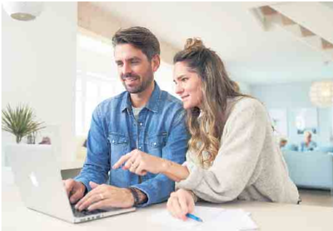
Nachrechnen lohnt sich: Zur Verbesserung der Eigenkapitaldecke gibt es verschiedene Möglichkeiten.

Immobilienkäufer können oft den gesamten Kaufpreis finanzieren