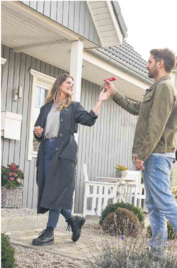
Auf direktem Weg ins Traumhaus: Auch Finanzierungen des gesamten Kaufpreises sind heute keine Seltenheit.

Tipps und Tricks für mehr Eigenkapital Um die Eigenkapitalquote zu erhöhen, gibt es mehr Möglichkeiten als das klassische Sparbuch. Aktien, Rentenversicherungen oder Fondssparpläne können ebenfalls zur Verbesserung der Konditionen beitragen, ebenso eignet sich weiteres Immobilienvermögen. Aber auch Eigenleistungen oder öffentliche Förderungen wie von der Kreditanstalt für Wiederaufbau (KfW) oder Zuschüsse einzelner Landesbanken akzeptieren die Banken als Eigenkapitalersatz. „In den Beratungsgesprächen zeigt sich immer wieder, dass es mehr Optionen gibt, als die Darlehensnehmer zunächst parat haben“, berichtet Matthias Zetzl von Dr. Klein weiter. Welche davon möglich und sinnvoll sind, hängt immer von der individuellen Situation ab. In einer umfassenden Bera-