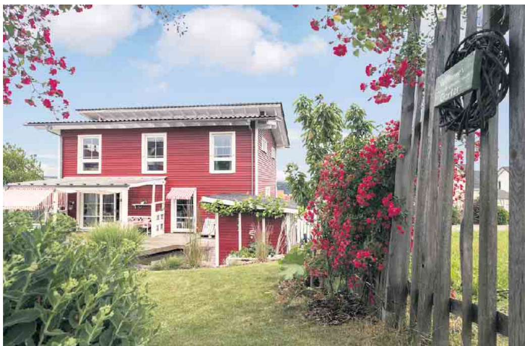
Wohlfühlwohnen gelingt in einem individuell geplanten Holz-Fertighaus sicher.

Kein Fertighaus gleicht dem anderen, denn jedes einzelne wird nach den Wünschen der Baufamilie geplant. Die Gestaltungsmöglichkeiten dabei sind unzählbar: von der Architektur über den Grundriss bis hin zur Ausstattung wird alles individuell ausgesucht und entworfen. „Meist werden Musterhäuser der Hersteller oder gerne auch das Ferienhaus aus dem letzten Traumurlaub am Meer oder in den Bergen als Ideengeber für die Hausplanung herangezogen“, weiß Fabian Tews, Pressesprecher des Bundesverbandes Deutscher Fertigbau (BDF). „So werten Schwedenhäuser, Friesenhäuser, Alpenhäuser oder auch mediterrane Villen in Holz-Fertig-