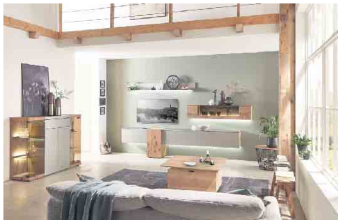
Wer klimafreundlich einrichten möchte, sollte beim Möbelkauf genau hinschauen.

Die bewusste Materialauswahl der Möbelhersteller mit dem „Goldenen M“ macht es Endverbraucher beim Möbelkauf leicht, denn zertifizierte Möbel sind nachweislich gesundheitsverträglich. Weitere Vorzüge beim Blick auf klimafreundliches Einrichten bieten Möbel mit einem hohen Anteil an Massivholz. Denn der Werkstoff aus dem Wald stammt hierzulande aus nachhaltiger Forstwirtschaft: seit über 300 Jahren darf in Deutschland nicht mehr Holz geerntet werden wie nachwächst. Ebenfalls klimafreundlich ist die Weiterverarbeitung des Naturmaterials mit nied-