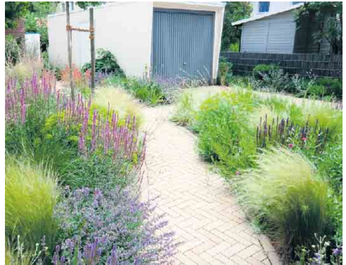
Eine sehr gelungene, artenreiche und harmonische Komposition verschiedenster Stauden.