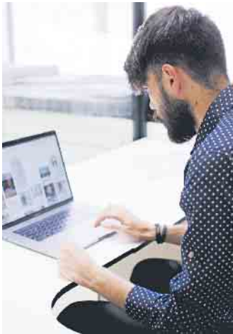
Eigene Qualifikationen, Berufserfahrungen und Stärken darf man online selbstbewusst darstellen.

online nach geeigneten Kandidaten und verschaffen sich im Web einen ersten Eindruck. Die eigenen Profile sollten daher aktuell und frei von eher fragwürdigen Inhalten oder Schnappschüssen sein. Zudem werden viele Positionen direkt über Empfehlungen und Netzwerke besetzt. Ein aktives Auftreten auf geeigneten Plattformen kann sich somit auszahlen.