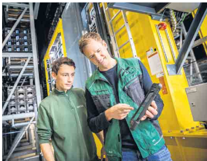
Die Ausbildung zur Fachkraft für Lagerlogistik in der Brauerei dauert drei Jahre, Voraussetzung ist ein Hauptschulabschluss.

Berufe: Fachkräfte für Lagerlogistik haben in Firmen eine bedeutsame Funktion