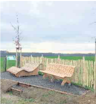
Zur erfolgreichen Umsetzung dieses Ruheplatzes mit hohem Erholungswert hat der Bürgerverein Hämmern e. V. (Wipperfürth) die Finanzmittel erhalten.

Dorfgemeinschaften und eingetragene Dorfvereine können für ihre Ideen und Vorhaben eine einmalige finanzielle Unterstützung beim Oberbergischen Kreis beantragen. Hierfür wurde die Richtlinie zur Förderung von Vorhaben des ehrenamtlichen Engagements in den Dörfern des Oberbergischen Kreises (Förderrichtlinie Oberbergische Dörfer) aktualisiert. Zuvor hatte der Kreistag des Oberbergischen Kreises mit dem Kreishaushalt 2023/2024 eine Summe in Höhe von 100.000 Euro für die Dorfentwicklung bereitgestellt. So möchten Politik und Verwaltung erneut das vielfältige ehrenamtliche Engagement in den mehr als 1.440 Dörfern und Siedlungsgemeinschaften im Oberbergischen Kreis stärken. „Ich freue mich, dass der Ober-