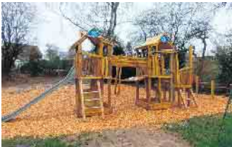
Dieses Klettergerüst mit Rutsche in Reichshof-Welpke haben die Dorfbewohner mit den Fördergeldern angeschafft.