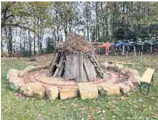
Diese Feuerstelle ist neuer Mittelpunkt des Dorfplatzes in Gummersbach-Lobscheid und wurde ebenfalls mit Geldern aus der Förderrichtlinie Oberbergische Dörfer finanziert.

geplanten Vorhaben bis zum 15. November 2024 erfolgreich umgesetzt werden. Für Fragen aller interessierten Dorfgemeinschaften steht Silke Hund, Telefon 02261 88 6133, E-Mail silke.hund@obk.de zur Verfügung. Ausführliche Informationen zur ‚Förderrichtlinie Oberbergische Dörfer‘ auf www.obk.de/fod .