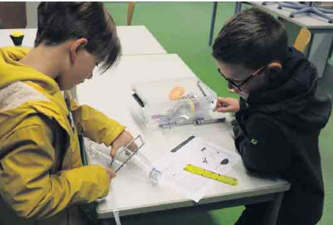
Aus alten Plastikflaschen bauen die Teilnehmenden der Forscherferien eigene Wetterstationen

Forscher-Ferien an der Gesamtschule Waldbröl