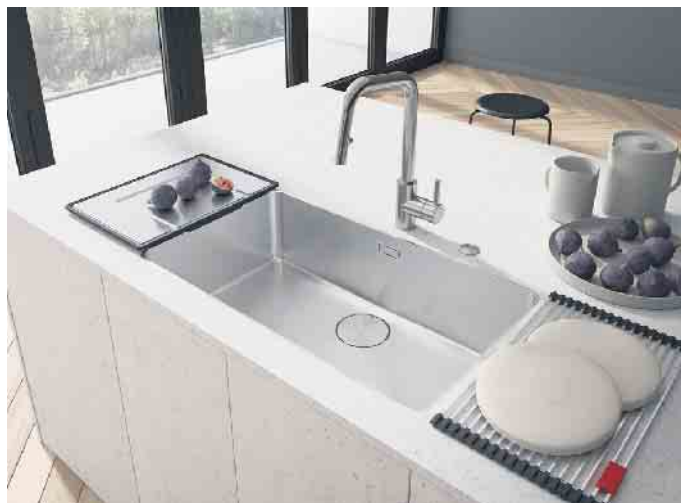
Blickfang Spüle: Filigran, zeitlos elegant und gefertigt mit höchster Präzision ist dieses Edelstahlbecken mit seinem nur 6 mm schmalen Rand. Passgenau gefertigt ist auch das Zubehör: die Rollmatte und das mobile Tropfteil. (Foto: AMK)

scheidung sollte man am besten in einem Küchenstudio oder in einem Möbelhaus treffen“, empfiehlt AMK-Geschäftsführer Volker Irle. (AMK)