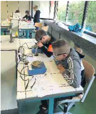
Mit Laborequipment betätigten sich die Teilnehmenden als Naturwissenschafts-Detektive und führten forensische Untersuchungen durch

zum Forschen begeistert - und in unseren Forscherklassen können sie dann, wenn sie an unsere Schule wechseln, ihre Ideen weiterverfolgen.“ In unterschiedlichen Workshops aus dem MINT-Bereich konnten die jungen Forscher:innen zu vielfältigen Themen forschend tätig werden. Neben forensischen Untersuchungen von Fingerabdrücken und Fußspuren im Workshop „CSI Naturwissenschafts-Detektive“ mussten mathematische Codes entschlüsselt werden, um gemeinen „Schokoladendieben“ auf die Schliche zu kommen. In dem Baustein Informatik wurden Lego-Mindstorm-Roboter gebaut und programmiert. Über Experimente zum Wetter konnten sie zu „Wetterexperten“ werden und chemische und physikalische Experimente zu „Luft“ durchführen. Durch die Zusammenarbeit mit den Mitarbeiterinnen in der Schulsozialarbeit der Schule konnte zudem täglich ein kleiner Mittagssnack angeboten werden. Wie ernst es der Gesamtschule Waldbröl ist, Talente zu fördern, zeigt sich auch am Tag der offe-