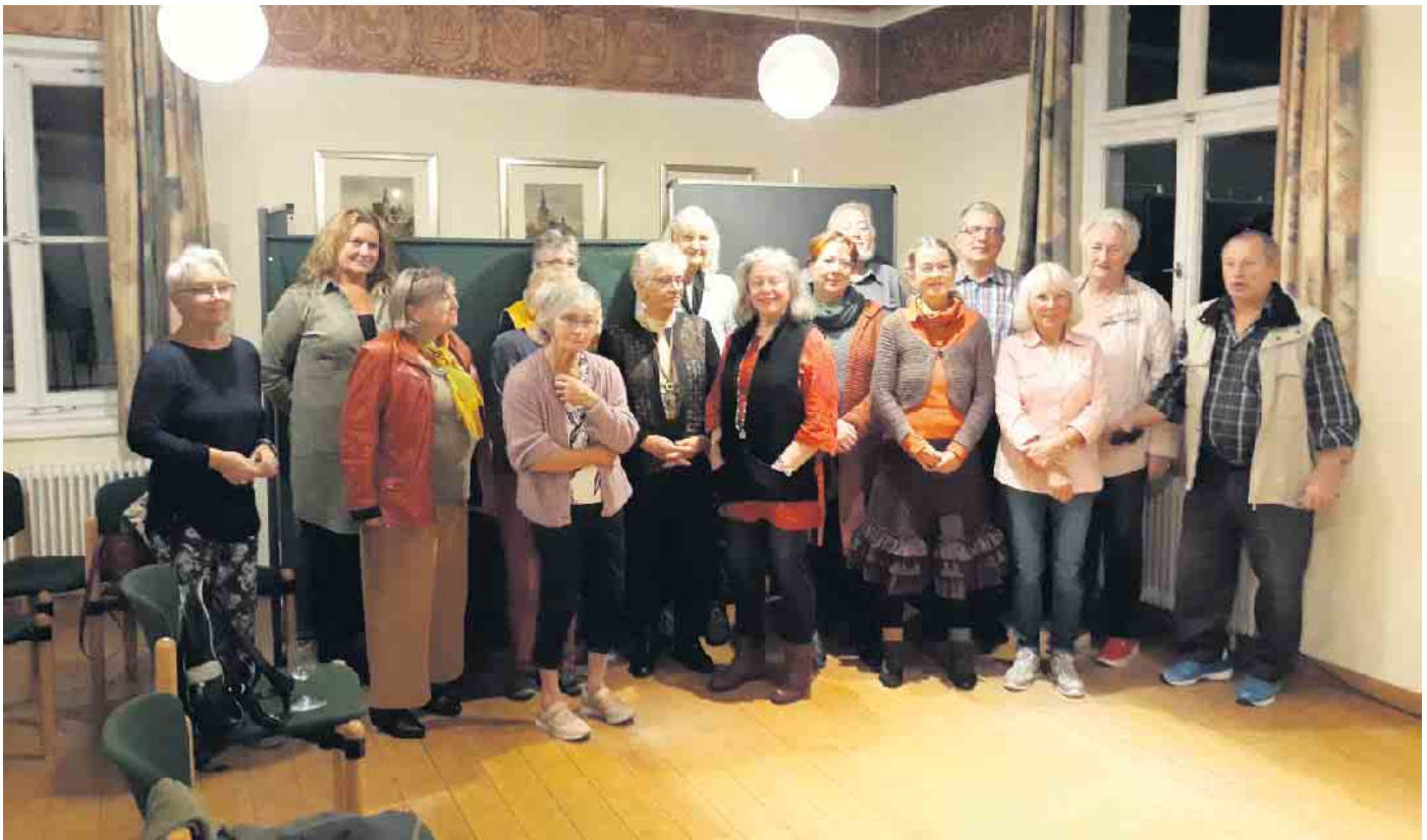
Gruppenbild der Vorleser*innen