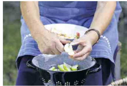
Vorbereitung zum Obstdörren beim Obstwiesenfest im LVR-Freilichtmuseum Lindlar.

Äpfel mit Birnen vergleichen, das ist tatsächlich möglich auf dem Obstwiesenfest am Sonntag, den 2. Oktober 2022 im LVR-Freilichtmuseum Lindlar. Zwischen 10 und 18 Uhr können hier verschiedene Obstsorten bestaunt werden, die heutzutage kaum mehr in den Supermärkten zu finden sind. Darüber hinaus stehen auch die fachkundige Beratung in Fragen rund um den Obstanbau, die Veredelung und die Sortenbestimmung im Vordergrund. Wer sich nicht sicher ist,