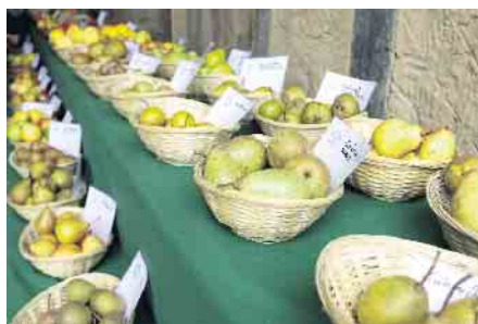
Birnensortenschau beim Obstwiesenfest beim LVR-Freilichtmuseum Lindlar.