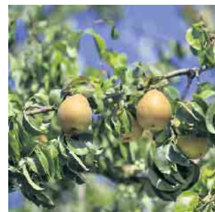
Apfelsorte Gräfin von Paris auf den Obstwiesen im Museumsgelände.