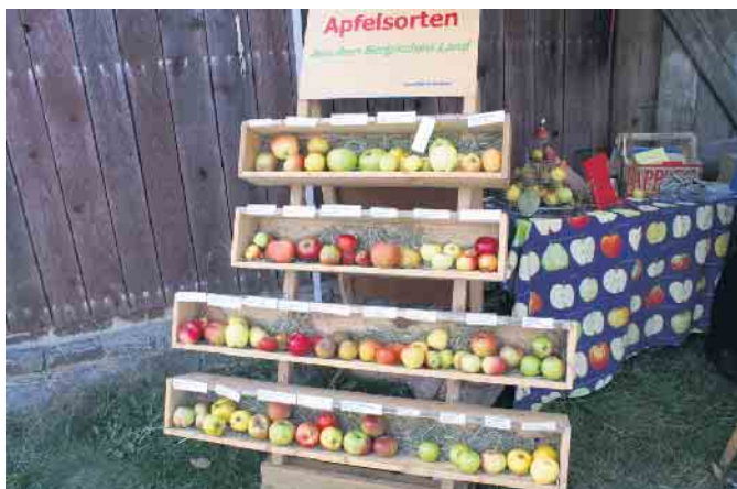
Apfelsortenschau beim Obstwiesenfest im LVR-Freilichtmuseum Lindlar.