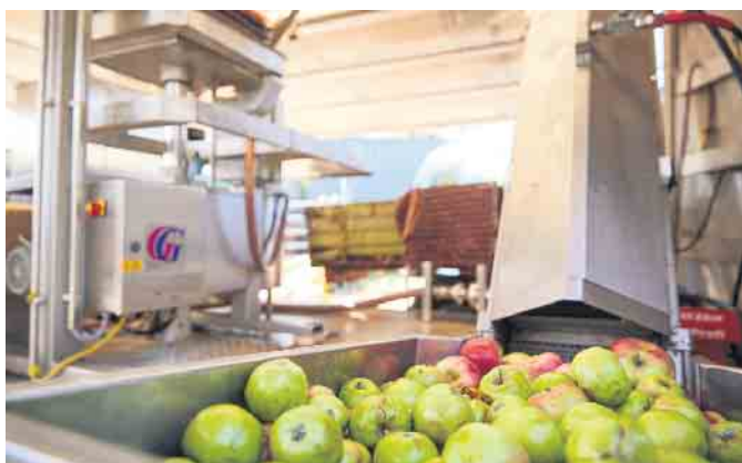
Mit der mobilen Saftpresse können die mitgebrachten Äpfel direkt gepresst werden. Der frische gepresste Obstsaft kann direkt mitgenommen werden.

Information: Kulturinfo Rheinland: Tel. 0 22 34 / 99 21 - 555