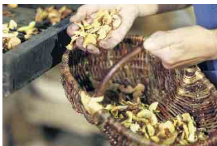
Getrocknete Äpfel frisch aus dem Dörröfen beim Obstwiesenfest im LVR-Freilichtmuseum Lindlar.