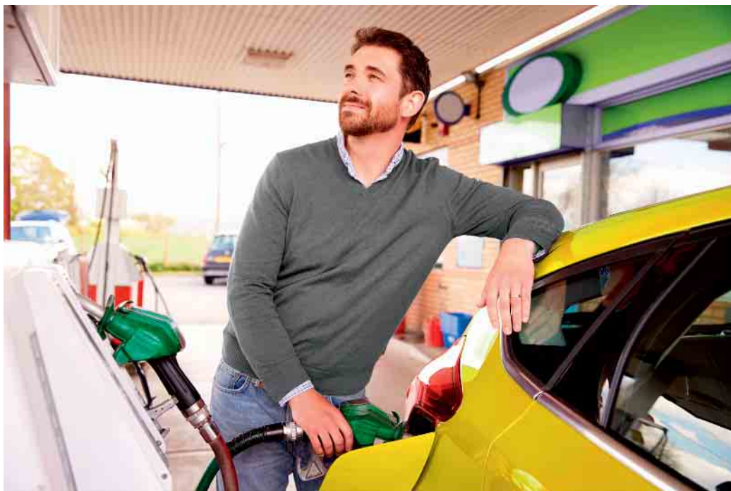
Fast alle Benzinmotoren vertragen den preiswerteren und umweltfreundlicheren E10-Kraftstoff.