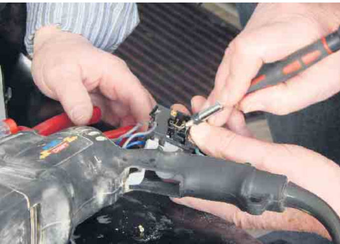
Ehrenamtliche Reparatoren sind auch am Weitblickstandort Morsbach tätig.