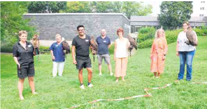
Das Team der Palliativstation nimmt auch Greifvögel auf die Hand.