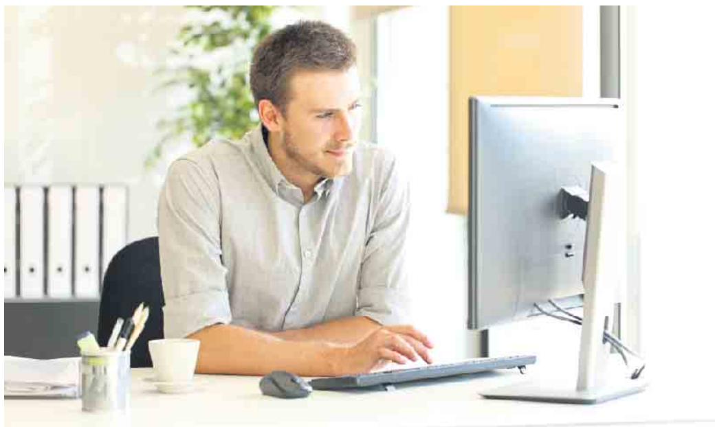
Die fortschreitende Digitalisierung verändert die Anforderungen an die Beschäftigten im Bankwesen rasant.

Die neue Ausbildungsordnung soll nach wie vor fachliche Kompetenzen wie Vermögensbildung, Vorsorge, Kreditgeschäft oder Bau- und Unternehmensfinanzierung vermitteln. Neben vielen digitalen Aspek-