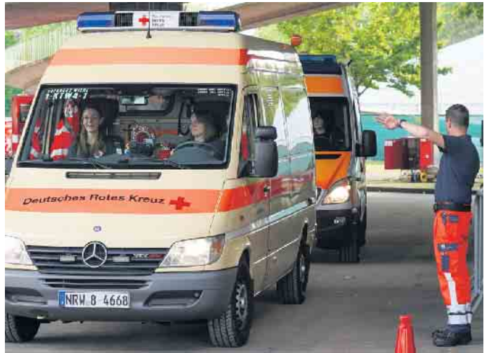
In vordefinierten Bereitstellungsräumen standen die Einsatzkräfte bereit, um im Bedarfsfall eingesetzt werden zu können.

Glücklicherweise verliefen jedoch sowohl das Spiel als auch die Nebenveranstaltungen ruhig und es kam zu keiner Alarmierung der Behandlungsplatz-Bereitschaft. Deutlich öfter gefordert war der sogenannte Patiententransport-Zug 10 (PT-Z 10). Diese taktische Einheit besteht aus insgesamt 20 Einsatzkräften der oberbergischen Hilfsorganisationen und des kreiseigenen Rettungsdienstes, die mit insgesamt neun Fahrzeugen im Bedarfsfall den Transport von bis zu zehn Patientinnen und Patienten übernehmen können.