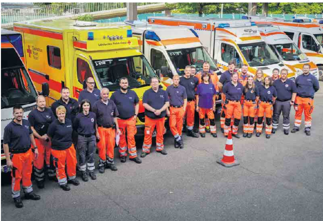
Die Einsatzkräfte des PT-Z 10, Einsatz in Köln.

Diese werden sich auch bei zukünftigen Einsätzen auszahlen und als Gesamtfazit waren sich alle Beteiligten einig, dass die vorgeplanten Konzepte in unserem Kreis und darüber hinaus im ganzen Bundesland ihre Leistungsfähigkeit positiv unter Beweis stellen konnten.