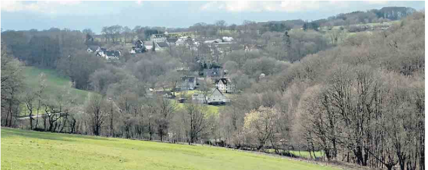
Der Dorfservice Oberberg ist Ansprechpartner für Dorfgemeinschaften und Dorfvereine im Oberbergischen Kreis.