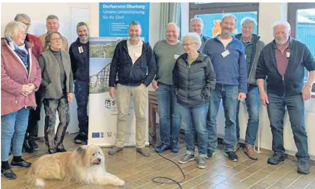
Viele Dorfvereine und Dorfgemeinschaften nutzen die kostenfreien Angebote des Dorfservice Oberberg, unter anderem die Veranstaltungsreihe Dorfgespräche.

www.obk.de/dorfservice und auf www.obk.de/dorfgespraeche .