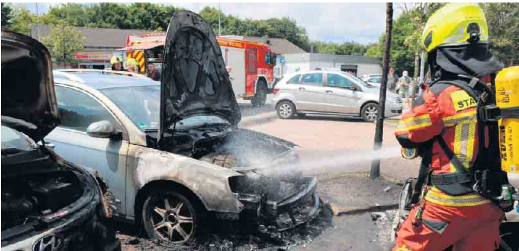
Die Feuerwehr löschte unter schwerem Atemschutz.