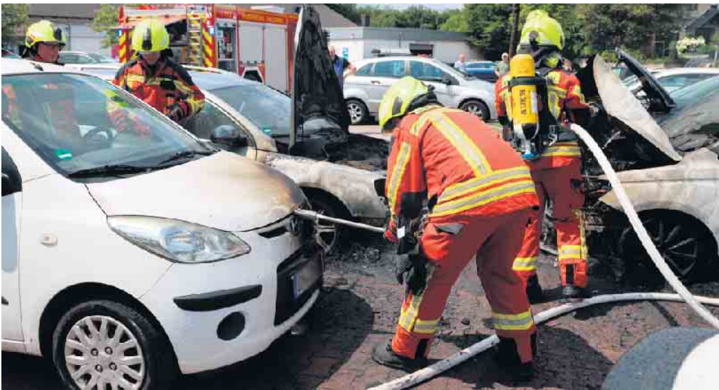
Das Öffnen der Motorhauben erforderte schweres Werkzeug.