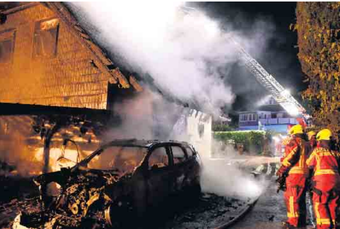
Der PKW war völlig ausgebrannt

Bei einem Wohnhausbrand gab es glücklicherweise keine Verletzten