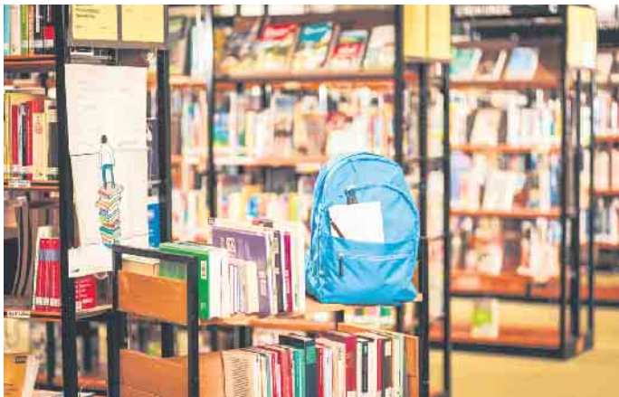
Der Kulturrucksack NRW macht zusätzlich Station in vier Bibliotheken im Oberbergischen Kreis.

Morsbach Weitere Information auf www.obk.de/kulturrucksack und per E-Mail an