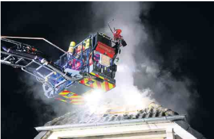
Arbeit am Dachstuhl mit der Drehleiter