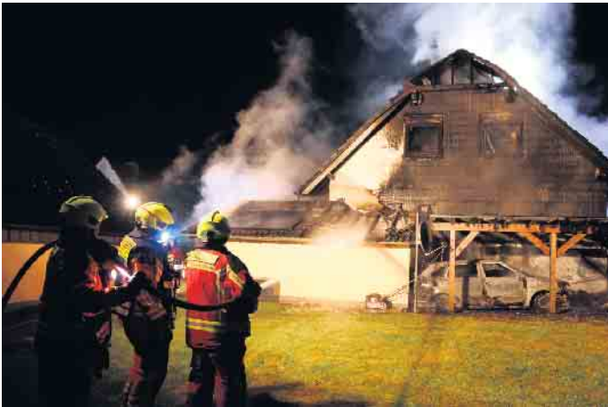
Löschen der Hausrückseite

bröler Feuerwehr, schilderte, dass kurz nach Mitternacht zunächst ein brennendes Fahrzeug gemeldet worden war. Beim Eintreffen hatte sich jedoch herausgestellt,