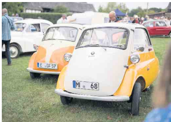
Präsentation der Kleinwagen: Die legendäre BMW-Isetta wurde im Volksmund „Knutschkugel“ genannt.