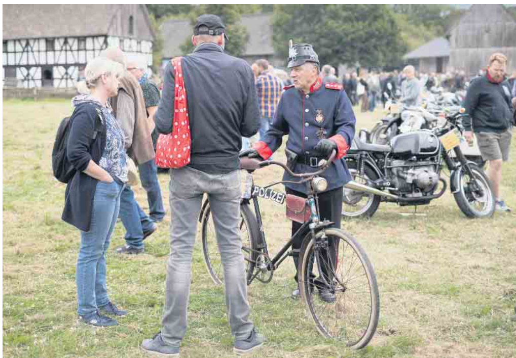
Historische Zweiräder geben bei PS & Pedale im LVR-Freilichtmuseum Lindlar ein Stelldichein.

Treffen und Ausstellung historischer Zweiräder und Kleinwagen