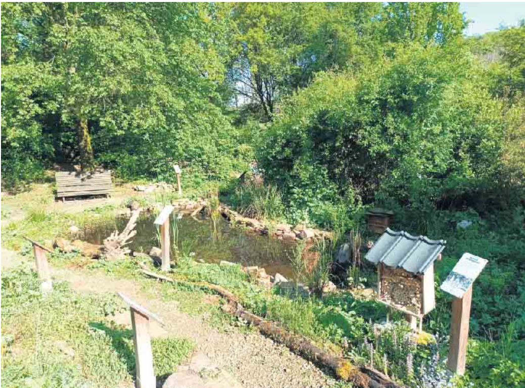
Der Naturschaugarten in Reichshof-Brüchermühle.

Ein Naturgarten fördert die Artenvielfalt, da heimische Wildblumen und Gehölze die Lebens- und Nahrungsgrundlage für unsere heimische Tierwelt sind. So sind 90 Prozent unserer pflanzenfressenden Insektenarten - beispielsweise Schmetterlingsraupen - auf wenige oder sogar nur eine heimische Wildpflanzenart spezialisiert. Deshalb kann in einem Garten mit einer großen Vielfalt dieser Pflanzen auch eine Vielzahl unterschiedlichster Tiere beobachtet werden. Naturgärten sind so Biodiversitätsinseln im besiedelten Raum und können damit als