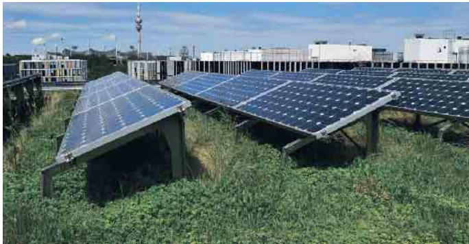
Photovoltaik und Gründächer- perfekte Synergie.

Diese Entwicklung zeigt, dass das Dachdeckerhandwerk eine wichtige Rolle in der Bauindustrie spielt und auch einen entscheidenden Beitrag für eine nachhaltige Zukunft leistet. (akz-o)