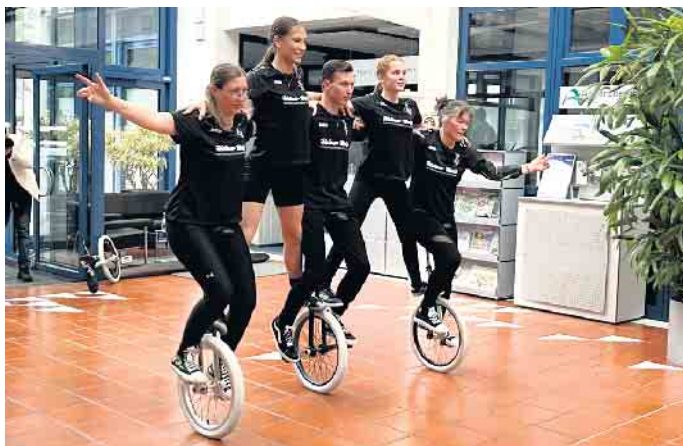
Die Nümbrechter Einradfahrerinnen und -fahrer

Sportlerinnen und Sportler des SSV Nümbrecht und des Homburgischen Gymnasiums waren mit dabei und konnte sich nun über ihre Platzierungen im Sportabzeichen-Wettbewerb des Kreissportbundes freuen. In der Kategorie „Vereine Klasse I“, in der Vereine mit bis zu 500 Mitgliedern sich miteinander messen, belegte der SSV Nümbrecht-Turnen e. V. den dritten Platz. Die Schülerinnen und Schüler des Homburgischen Gymnasiums konnten sich in der Vergleichsgruppe der Schulen mit Sekundarstufe I und II den ersten Platz sichern. Das wur-