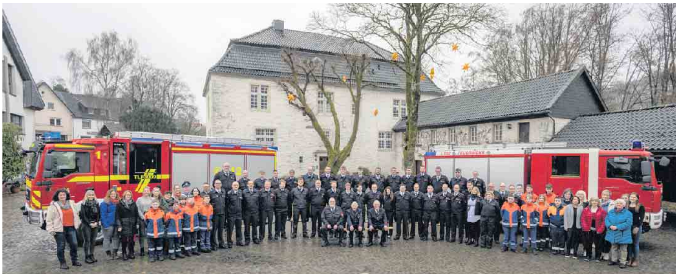
Die aktive Wehr mit der Jugendfeuerwehr, der Ehrenabteilung und der Damengruppe

Feuerwehr Denklingen hat ein super Programm vorbereitet