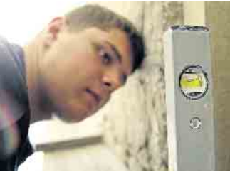
Bei der Ausbildung zum Ofen- und Luftheizungsbauer lernt man vielfältige Tätigkeiten kennen.

Der Einbau eines Ofens ist echte Handwerkskunst und gehört zu den kreativsten Tätigkeiten beim Innenausbau eines Hauses. Nach der Ausbildung stehen viele Türen offen