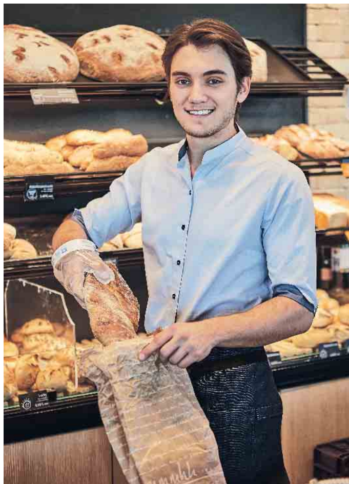
Ob Abitur oder Hauptschulabschluss, das Bäckerhandwerk steht jedem entsprechend seinen Qualifikationen offen.

Der Stellenfinder gibt einen Überblick über freie Stellen, Ausbildungs- und Praktikumsplätze: www.back-dir-deine-zukunft.de/stellenfinder (akz-o)