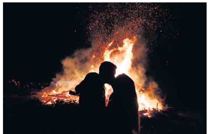
Pärchen am Feuer

Heischeider Feuerwehrmanns gekommen und sich einig, dass das nicht ihr letztes Osterfeuer in Heischeid war. Für die Jugendfeuerwehr ging es nach dem Aufräumen am Ostersonntag gleich weiter - mit den Vorbereitungen auf einen Löschangriff beim Feuerwehrfest am 13. Mai in Brüchermühle. (mk)