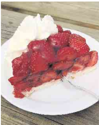
Selbstgemacht und lecker

Der Verein entwickelte sich als ein absolutes Erfolgsmodell. Tatkräftig zupacken, manchmal mit dem Kopf durch die Wand