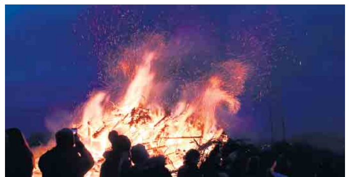
Osterfeuer in der Dämmerung