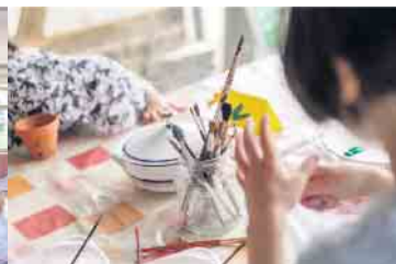
Aktion in der kreativen Mitmachwerkstatt im LVR-Freilichtmuseum Lindlar.

Freier Eintritt für 2 Erwachsene beim Schul- und Gartentag am Sonntag, den 30. April 2023 im LVR-Freilichtmuseum Lindlar Bei Vorlage dieses Coupons erhalten Sie am 30.04.2023 freien Eintritt für 2 Erwachsene im LVR-Freilichtmuseum Lindlar. Kinder und Jugendliche unter 18 Jahren haben freien Eintritt