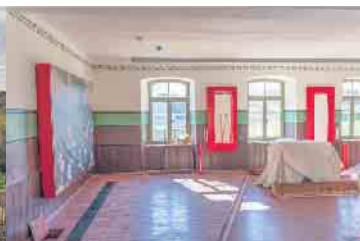
Beim Schul- und Gartentag ist die Schule Hermesdorf auf dem Museumsgelände zum ersten Mal öffentlich zugänglich.