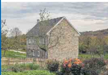
Die Dorfschule aus Waldbröl-Hermesdorf war vor Ort nicht mehr zu erhalten und wurde in ganzen Teilen in das Museum versetzt.

Auch in den Museumsgärten werden Aktionen angeboten. Hier stehen Fachkräfte für Fragen, Informationen und kleinere Gartenführungen bereit. Gegen Spende kann Saatgut alter Sorten erworben werden – solange der Vorrat reicht. Für Kinder gibt es von 10 bis 14 Uhr eine Mitmachaktion „rund um die Zwiebel“. Vorführungen gibt es unter anderem im Arche-Garten und im Hausgarten des Bandweberhauses Ronsdorf. Für das leibliche Wohl sorgen die Museumsgaststätte Lingenbacher Hof, der historische Kiosk aus Wermelskirchen und das Zitschbüdchen des Museumsfördervereins.