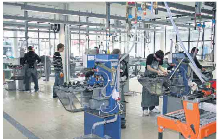
Ausbildung in der Flachglasindustrie.