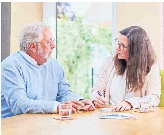
Bei der Vor-Ort-Beratung werden die Pflegebedürftigen in ihrer eigenen Häuslichkeit besucht.

men ist eine Tochter des Verbandes der Privaten Krankenversicherung und berät kostenfrei und unabhängig - zum Beispiel am Telefon unter der Nummer 0800-10188-00. Die Hot-