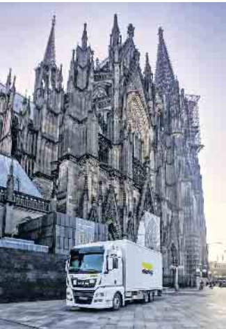
Köln ist die Heimat des traditionsrei- chen Speziallogistiklers Hasenkamp.