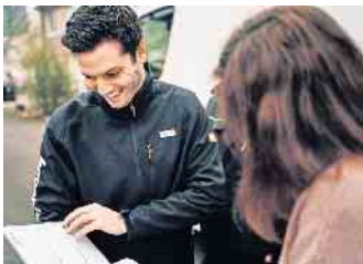
Abwechslung ist Trumpf: Beim Speziallogistiker kann jeder und jede Mitarbeitende permanent das Jobprofil verändern und nach einer internen Schulung quasi ‚horizontal‘ wechseln.

Im 18. Jahrhundert war sie auf Jahrmärkten, an Fürstenhöfen und auf Volksfesten in ganz Europa eine Sensation. Mit elf Jahren war sie dreieinhalb Meter lang, 1,70 Meter hoch und 2.500 Kilogramm schwer. Die Rede ist vom Nashorn Clara, dessen lebensgroßes Abbild von Jean-Baptiste Oudry üblicherweise im Staatlichen Museum Schwerin hängt. Wegen Renovierungsarbeiten ist das Museum seit 2021 für drei Jahre