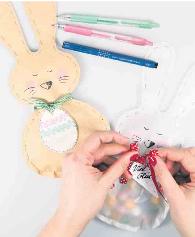
Ob für die Eiersuche oder als süße Geschenkverpackung: Über die Osterhasentüten freuen sich Jung und Alt.

cher und Kreativstifte wie den Fineliner Drawing Pen in Schwarz und den Gelschreiber G2-7, den es von Pilot in einer Auswahl von 31 bunten Farben gibt.