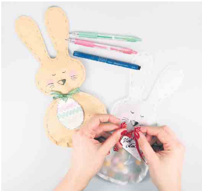
Niedliche Osterhasentüten machen die Eiersuche noch spannender und abwechslungsreicher.

Hinzu kommen ausgedruckte Vorlagen für Hase und Anhänger, die man zum Beispiel unter www.pilotpen.de/diy-tutorial kostenlos herunterladen kann.