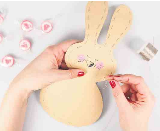
Mit einem Faden werden beide Hälften zusammengenäht. Kurz vor Schluss ein kleines Loch lassen, die kleinen Naschereien reinstecken und zunähen.

Schritt 3: Für den Anhänger die ausgedruckte Ostereivorlage oder eine selbst gewählte Form aus Papier ausschneiden und mit verschiedenfarbigen G2-7 Stiften individuell gestalten. Am Ende lochen und mit Schleifenband an der Hasentüte befestigen. Fertig ist das süße Ostergeschenk! (djd)