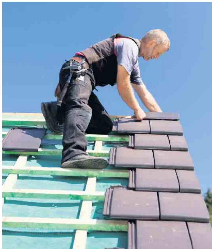
Wer viel im Freien arbeitet, sollte sich mit medizinischer Sonnenlotion und der richtigen Bekleidung vor UV-Strahlen schützen.

Tipps hierzu auch auf www.actinicalotion.com . So ist es sinnvoll, sich gerade in der warmen Jahreszeit einen Trick der Südeuropäer abzuschauen: Diese halten in der Mittagszeit eine lange Siesta und sind so weniger Risiko durch die UV-Strahlung ausgesetzt. Zumindest sollte in diesen Stunden die Arbeit in den Schatten verlegt werden. Hier sind auch Arbeitgeber in der Pflicht, die außen liegenden Arbeitsstellen abzuschirmen beziehungsweise zu überdachen. Und nicht zuletzt können sorgfältige Selbstbeobachtung und regelmäßige Vorsorgeuntersuchungen beim Hautarzt helfen, Hautkrebs möglichst frühzeitig zu entdecken und behandeln. (DJD)