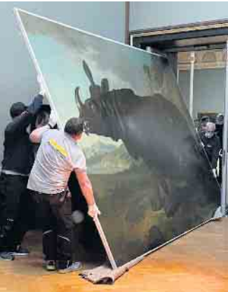
Das Gemälde von Nashorn Clara hängt üblicherweise im Staatlichen Museum Schwerin. Da das Haus wegen Renovierungsarbeiten für drei Jahre geschlossen ist, ging Clara mit großem Aufwand auf Reisen - unter anderem ins berühmte Rijksmuseum nach Amsterdam.