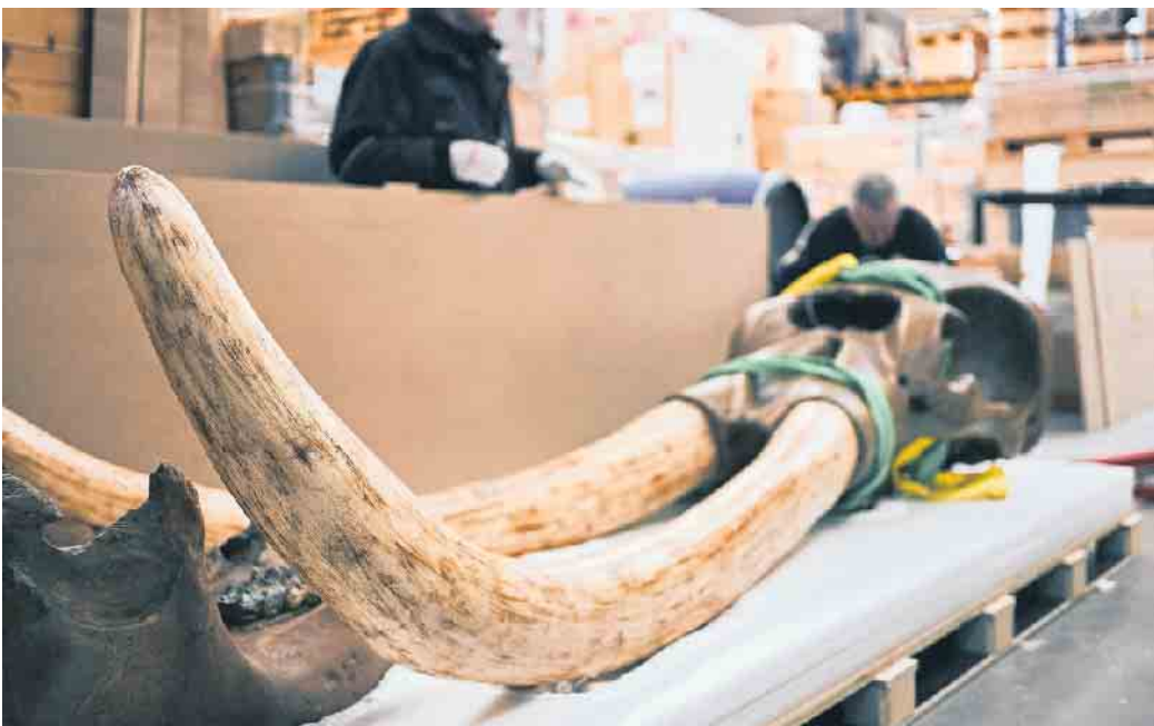
Das Amerikanische Mastodon war eine Art der Rüsseltiere aus der ausgestorbenen Gattung Mammut. Der Transport der kostbaren Zähne stellt auch für spezialisierte Kunstlogistiker eine Herausforderung dar.