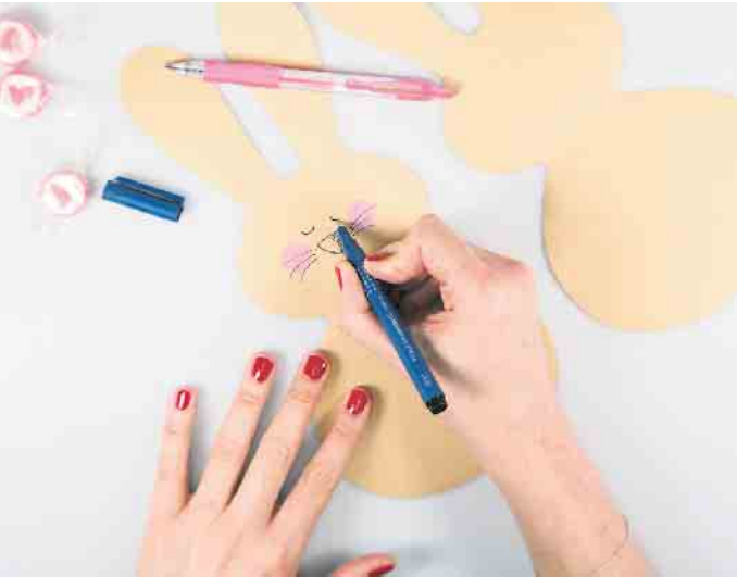
Ist der Osterhase ausgeschnitten, bekommt er ein hübsches Gesicht aufgemalt.

Schritt 1: Die Hasenvorlage ausdrucken, ausschneiden und auf das Pack- oder Transparentpapier legen. Dann den Umriss nachzeichnen und ausschneiden. Für eine Hasentüte werden zwei Papierhasen benötigt. Anschließend mit dem schwarzen Drawing Pen ein Hasengesicht mit Augen, Nase und Barthaaren aufzeichnen. Für rosa Wangen den Gelschreiber G2-7 in Rosa verwenden.