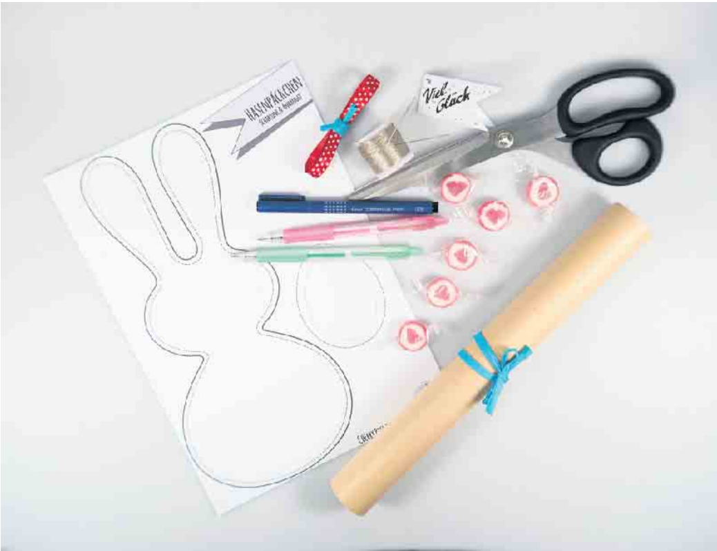
Das Material für die Osterhasentüten auf einen Blick.

Um die Hasentüten zu basteln, braucht man zunächst Pack- oder Transparentpapier, eine Nadel, einen stabilen Faden, ein Schleifenband, eine Schere, einen Lo-