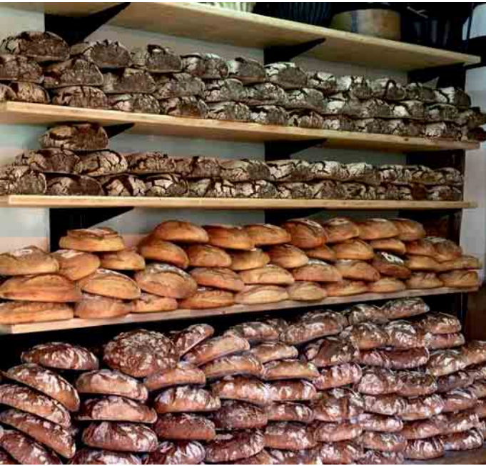
Die Auswahl an Broten ist auch beim kommenden Backesfest wieder groß.

genheit dazu. An beiden Tagen beginnt das Fest jeweils um 11 Uhr. Parkplätze stehen in ausreichender Zahl am Ortseingang und in der Ortsmitte zur Verfügung. Weitere Infos zum Backesfest gibt es auch unter 0177-4913421