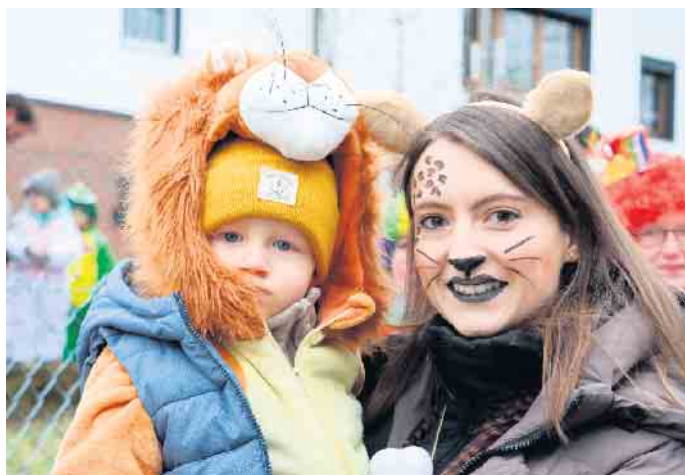
Jecken am Straßenrand