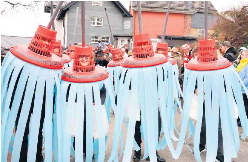
Die „Schönenbacher Määädchen“ als Wischmopps

Ebenfalls mit ihren Majestäten waren die KV Bielstein und die KG Herchen mit ihrer Tanzgruppe „Flamingos“ unterwegs, gefolgt von dem kleinen Karnevalsverein Oesinghausen, der in rosafarbenem Sportdress ankündigte, nun Bauch, Beine und Po zu trainieren: „Wir sind einfach skinny.“ Ein Highlight war die Lokomotive der Partyvögel, die unter dem Motto „Die Dampflokomotive rauchte steuerfrei - heute zahlt man CO 2 “ durch den Ort tuckerte. Zwischen der Soundkulisse der Partyvögel und dem „Gebläse“ der Oberbergischen Gurktaler hüpfte die Große Garde der KG Wildberg und ebenso die Eckenhäaner Tanzbienen über die Straße, während sich die Karnevalsfreunde Erblingen und Perseifen als Stehlampen mit Wackelkontakt präsentierten. Neulinge auf dem „Schürmicher Zoch“ waren die Dreiseler Karnevalsjecken als „Ghostbuster“, Peter Arnold als „Post Peter“, der jahrelang um den Zustellbezirk