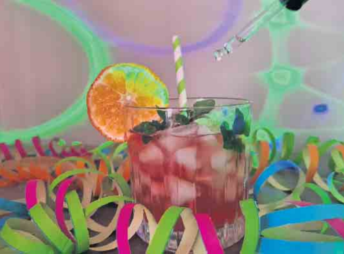
„Lass dich nicht K.o.-Tropfen“ - warnt das Netzwerk Oberberg no- gegen Gewalt und gibt Tipps und informiert über Hilfsangebote.

Sensibilisierung für K.o.-Tropfen und damit verbundenen sexuellen Übergriffen