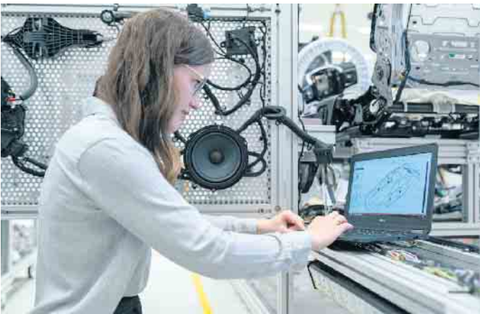
Kupfer spielt in vielen zukunftsweisenden Berufen eine wichtige Rolle - zum Beispiel in der Entwicklung und Produktion von E-Autos.

Zukunftssichere Karrierechancen rund um das vielseitige Metall