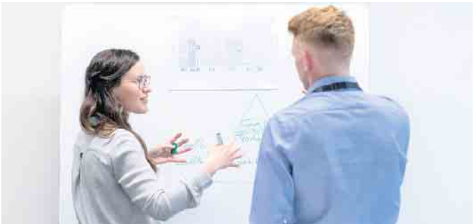
Ingenieure und Forscher arbeiten an zukünftigen Einsatzmöglichkeiten von Kupfer, welche die Energieeffizienz verbessern, mehr Sicherheit schaffen oder neue Kommunikationstechniken unterstützen.

der Münzprägung eingesetzt. So sorgt das rote Metall für sichere Arbeitsplätze in vielen Bereichen - auch außerhalb der Kupferindustrie. (DJD)