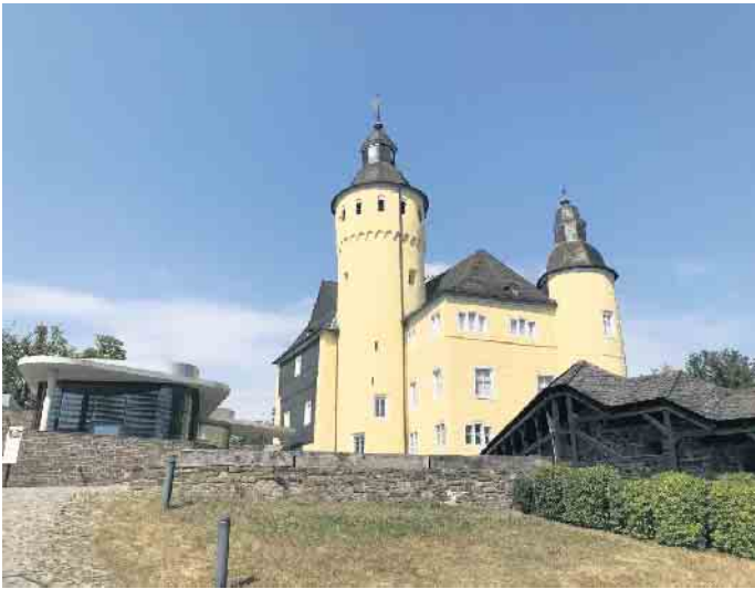
In der Neuen Orangerie (l.) auf Schloss Homburg findet das Konzert der regionalen Preisträgerinnen und Preisträger von „Jugend musiziert“ statt.

Oberbergischer Kreis. Am Sonntag, 23. Februar, findet das traditionelle Konzert der Preisträgerinnen und Preisträger des Regionalwettbewerbs „Jugend musiziert“ in der Neuen Orangerie auf Schloss Homburg statt. In diesem Jahr stehen erstmals Preisträgerinnen und Preisträger aus dem Oberbergischen Kreis und dem Rheinisch-Bergischen Kreis auf der Bühne und werden für ihr außergewöhnliches musikalisches Können geehrt. Dabei werden gleich zwei Konzerte mit ausgewählten Beiträgen geboten: Um 11 Uhr findet die Ehrung der 5- bis 12-Jährigen statt. Nach einer Pause werden die 13- bis 17-Jährigen in einem zweiten Konzert um 15 Uhr, ihr musikalisches Talent präsentieren. Moderiert werden beide Konzerte von Kerith Müller, die an der Städtischen Max-Bruch-Musikschule Bergisch Gladbach den Fachbereich Blechblasinstrumente leitet. Darüber hinaus leitet sie das „Max-Bruch-Blasorchester“, das „Junge Blasorchester Rhein-Berg“ und das Blechblasquintett der Musikschule Bergisch Gladbach. Der Regionalausschuss und der JuMBO e. V. (mit Sitz in der Städtischen Max-Bruch-Musikschule in Bergisch Gladbach) organisieren den Wettbewerb und die Preisträgerkonzerte. Der Eintritt zu beiden Konzerten ist frei. Es stehen begrenzt Plätze zur Verfügung. Der bundesweite Musikwettbewerb wird bereits seit 1964 durchgeführt. Weitere Informationen auf www.schloss-homburg.de .