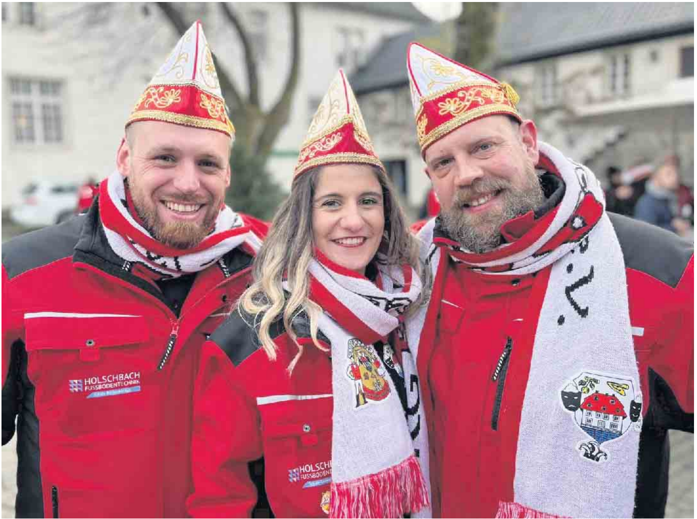
Prunksitzung in Denklingen: Das Dreigestirn freut sich schon riesig auf diese Veranstaltung