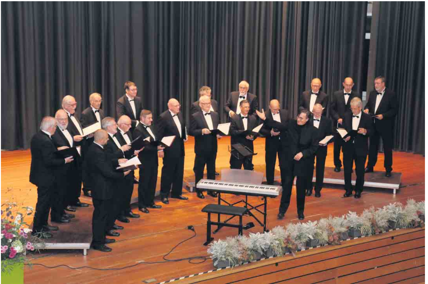
Die „Räuber“ läuten gesanglich das neue Jahr in Eckenhagen ein.