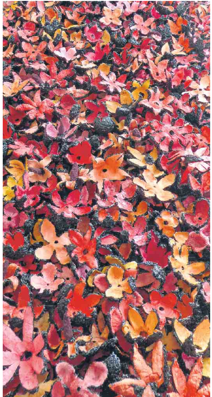
Ein Werk von Marion Menzel, auch zu sehen im Kunst Kabinett in Hespert.

Rückfragen zur Ausstellung: Axel Müller, 02262/ 79 79 66