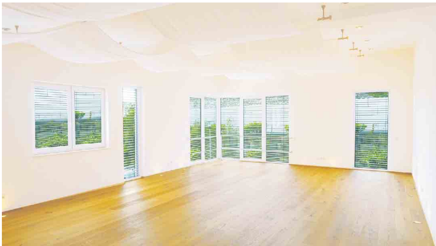
Der Kursraum in der VESTE1