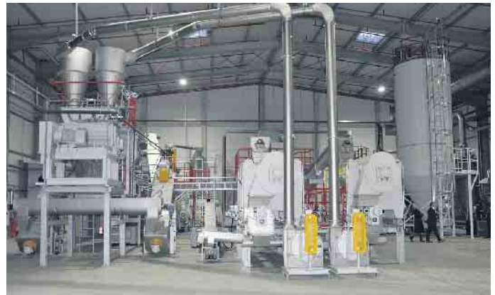
Alle Maschinen wie hier die nass-mechanische Anlage entsprechen dem neuesten technischen Standard, insbesondere was energiesparenden und umweltfreundlichen Anforderungen entspricht.

Als modern strukturiertes Familienunternehmen setzt die Hündgen Entsorgungs GmbH & Co. KG Anpassungen an sich verändernde ökologische oder ökonomische Bedingungen direkt um. Damit wird zum einen ein hoher ökologischer Standard im Sinne des Umweltschutzes garantiert. Zum anderen kann im Sinne der unternehmerischen Zielsetzungen ein guter Kundenservice durch gezielte persönliche Ansprache und Beratung in allen Entsorgungsfragen gewährleistet werden. Neben dem Transport von Abfällen, Wertstoffen und Wertstoffgemischen ge-