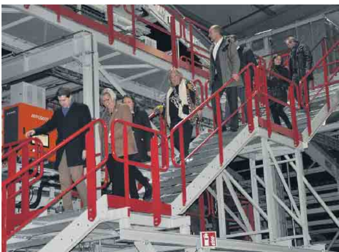
Auf großes Interesse stießen die Führungen durch den Maschinenpark und die ausführlichen Informationen direkt vor Ort.