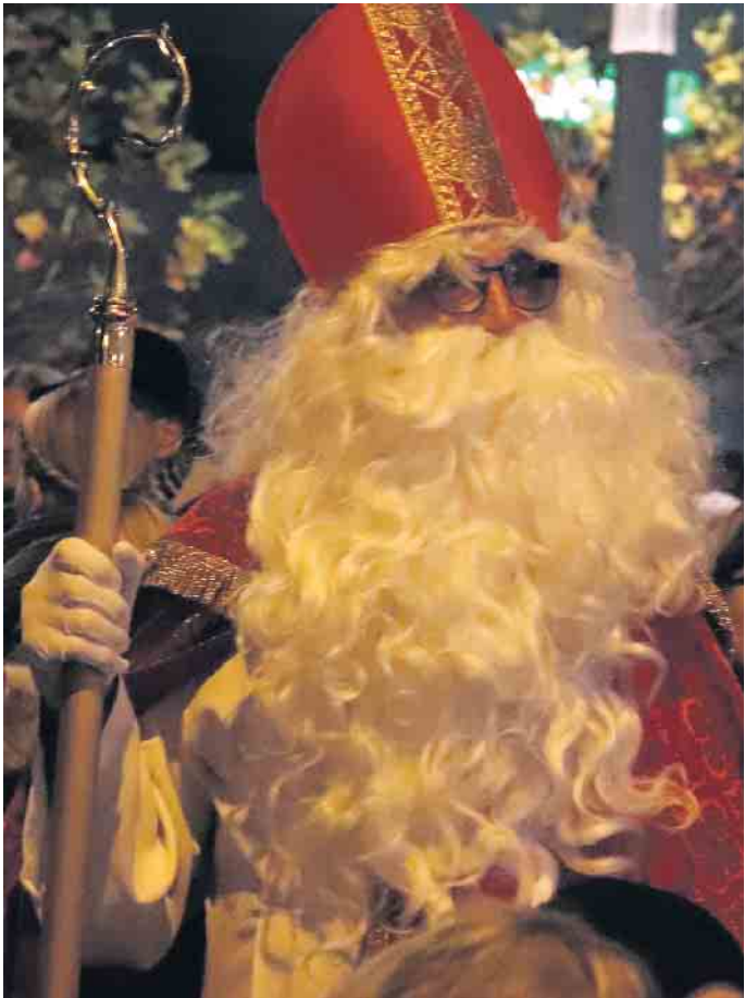
Der Nikolaus in Heimerzheim.

Am 15. Dezember findet um 19 Uhr in Odendorf im Dietrich-Bonhoeffer-Haus eine Ökumenische Taizé-Andacht statt. Pater Gregor wird das Friedenslicht mitbringen. Jeder, der es mitnehmen möchte, bringe bitte eine Laterne mit. Der ökumenische Kirchenchor unter der Leitung von Herrn Bosbach wird die Andacht musikalisch begleiten.