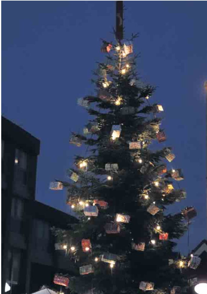
Der Weihnachtsbaum auf dem Gottfried-Velten-Platz