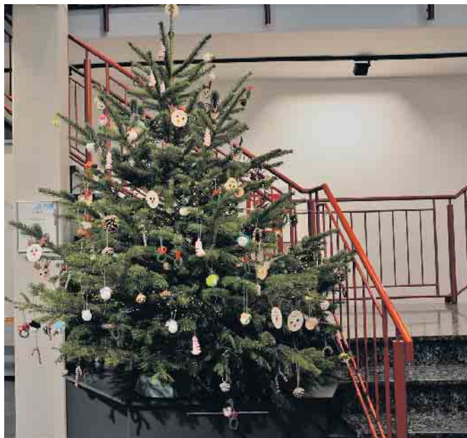
Von den Kindern prächtig geschmückt: der Weihnachtsbaum im Entrée der Fa. Specht.