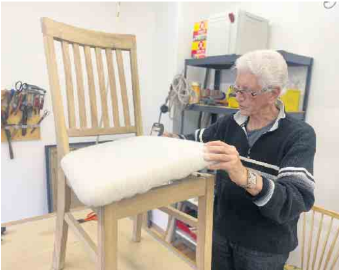
Die Räumlichkeiten wurden nach der Flut 2021 wieder saniert.