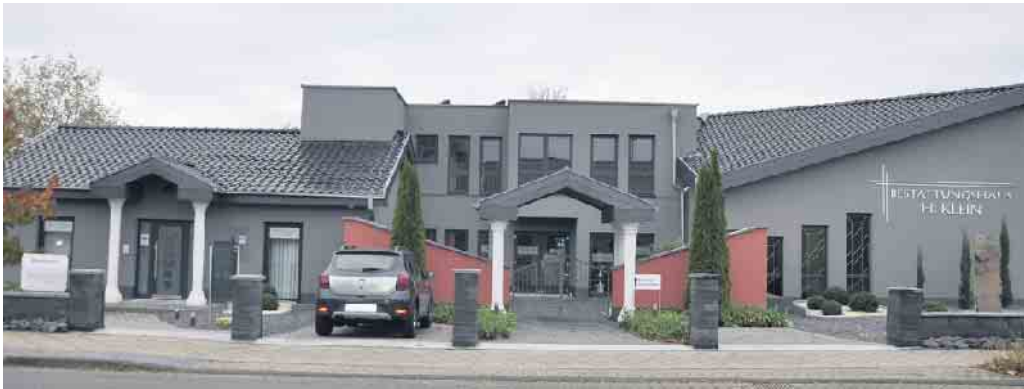
Das Geschäftsgebäude des Bestattungshauses H. Klein wurde in den letzten Monaten um einen Trakt im 1. Stock erweitert.

Die Flutkatastrophe vom Juli 2021, die auch in Rheinbach tobte, verschonte unser Unternehmen nicht. Nachdem nach einem Jahr die Renovierungsarbeiten fast abge-