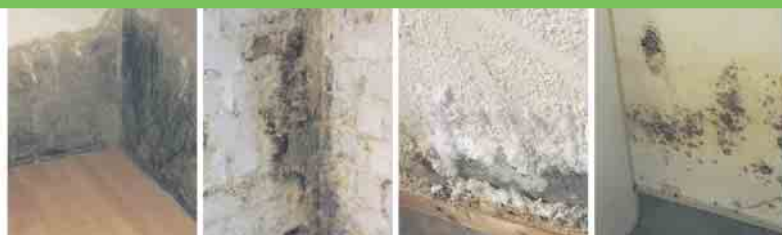
Defekte Horizontalsperre Querdurchfeuchtung Ausblühungen Schimmelbefall