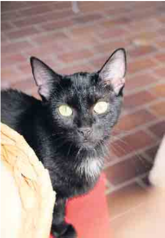
Tierheim u. Tierschutzverein Kreis Ahrweiler e. V., Claus Krah

Mehr Infos über sie gibt es hier: www.tierheim-remagen.de , Blankertshohl 25, 53424 Remagen. Tel. 02642/21600. Spendenkonten: Tierheim u. Tierschutzverein Kreis Ahrweiler e. V., KSK Ahrweiler IBAN DE14 5775 1310 0000 4107 87 + VoBa IBAN DE74 5776 1591 0201 8159 00.