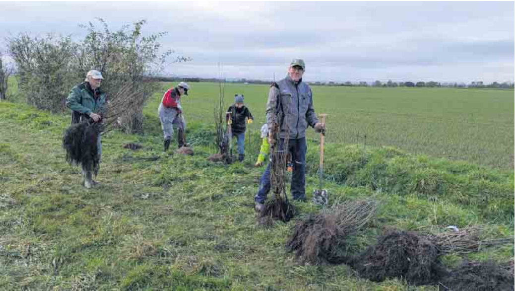
Ehrenamtliche Helferinnen und Helfer der NABU Kreisgruppe Bonn bei der Arbeit

Abschlussbericht Freiraumkonzept: https://www.swisttal.de/imperia/md/content/cms125/aktuelles/2024/2023_08_31_abschlussbericht_freiraumkonzept.pdf