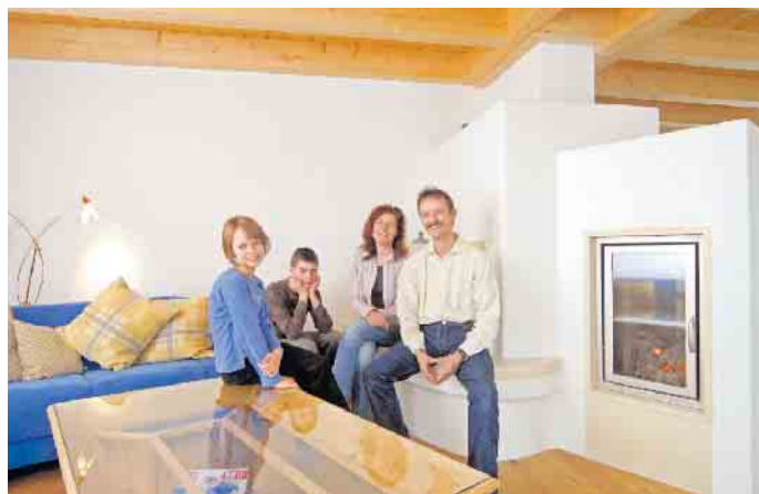
Wohlfühlklima fürs Familienheim: Der Traditionswerkstoff Lehmputz lässt sich als Trockenbausystem spielend leicht verarbeiten.

Die Lehmputz-Plattenelemente gibt es in verschiedenen Ausführungen, etwa als reine Wandbeplankung oder als Innendämmung. Wer sich die angenehme und energieeffiziente Wärme einer Wand- oder Deckenheizung ins Haus holen will, kann die Installation von Flächenheizung und Lehmputz in einem Arbeitsgang durchführen. In spezielle Plattenelemente sind bereits Heiz-/Kühlrohre eingelassen, die mit klassischen Presskupplungen verbunden werden. (DJD)