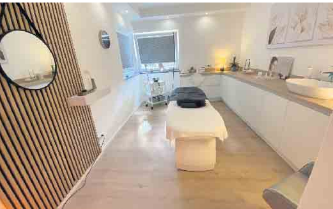
Die neuen Räumlichkeiten auf der Kölnerstr. in Heimerzheim

lich. Durch die Fortbildungen wird das Wissen, nicht nur im Bereich Hautgesundheit, ständig erweitert. Das hilft nicht nur bei einer passgenauen Beratung, sondern schult auch in der Anwendung moderner Technik, mit deren Hilfe tolle Ergebnisse erzielt werden können. Pünktlich zur Vorweihnachtszeit gibt es auch wieder viele Geschenkideen für Damen und Herren. Vorbeischaun lohnt sich also in jedem Fall (svs).