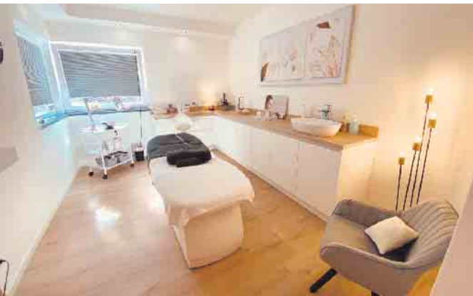
In der Kosmetikpraxis Harmonie der Sinne finden die Kunden eine Lösung für ihre Hauptprobleme.