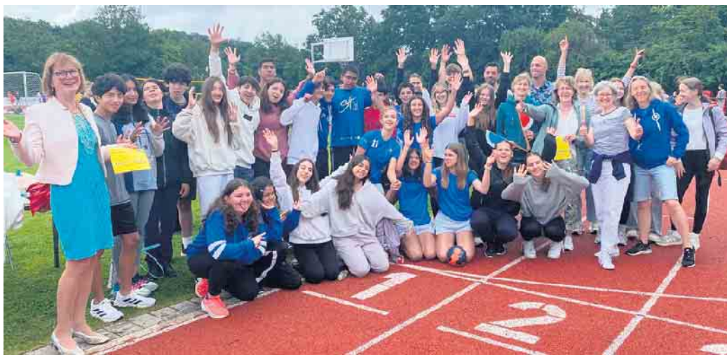
Die Teilnehmerinnen und Teilnehmer am Mexikoaustausch

Internationaler Schüleraustausch zwischen Swisttal-Heimerzheim und Mexiko-Stadt gelingt sportlich