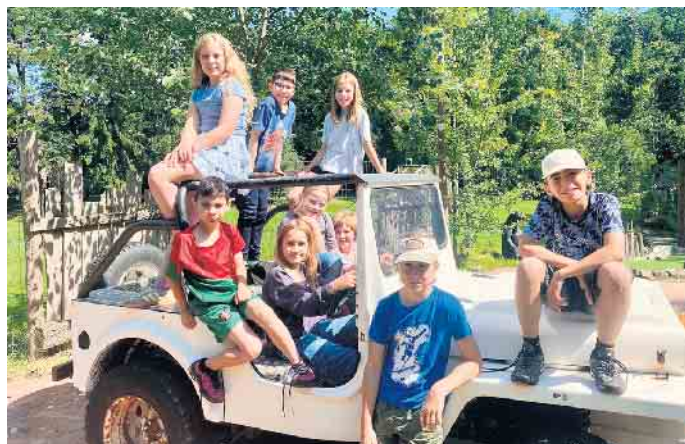
Teilnehmende und Betreuer der Ferienfreizeit

Möglich wurde diese tolle Ferienfreizeit dank der großzügigen Un-