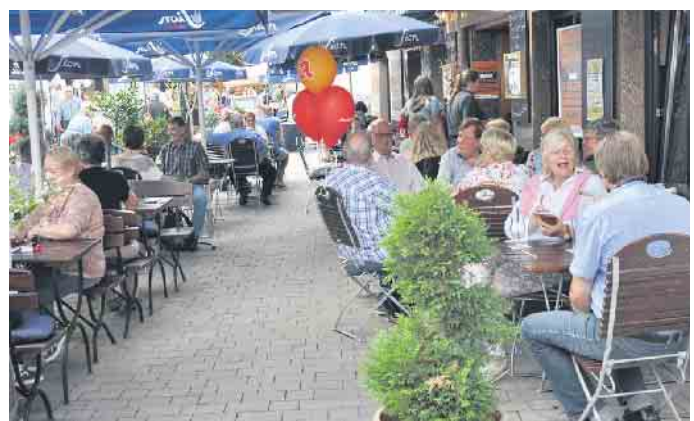
Für gemütliche Pausen laden die gastronomischen Betriebe und Stände zum Genießen und Plaudern ein.