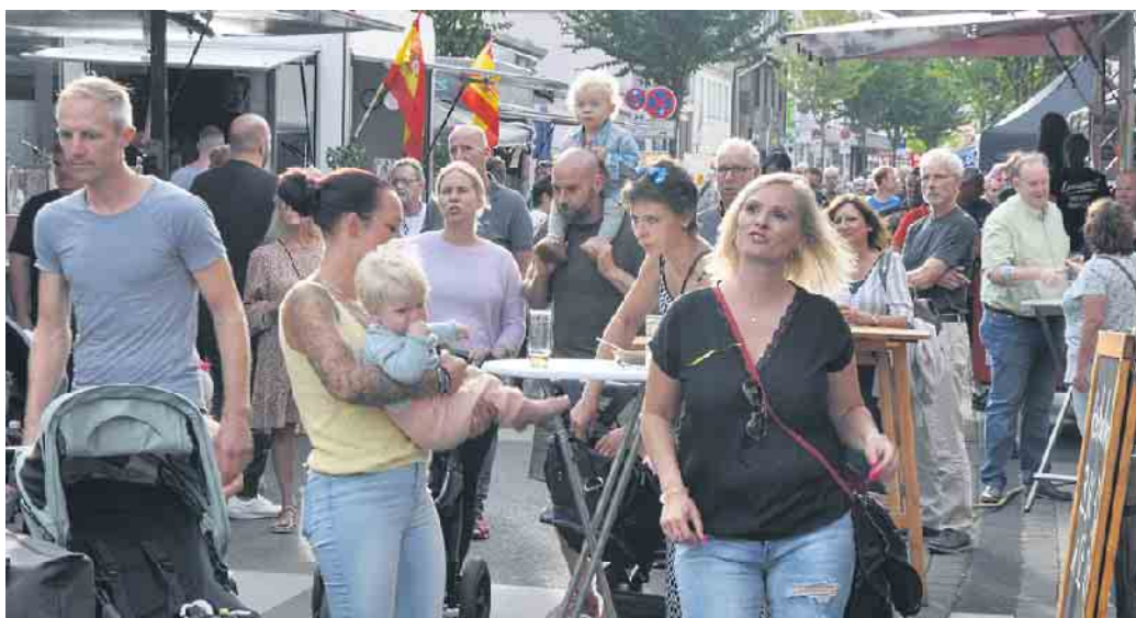
Auf einen viele Gäste hofft der veranstaltende Gewerbeverein Bornheim.

Die traditionelle Gewerbeschau richtet der Bornheimer Gewerbeverein am Sonntag, 3. September, in der Zeit von 11 bis 18 Uhr aus. Viele professionelle Aussteller werden sich und ihre Angebote auf der Königstraße präsentieren. Soziale und karitative Gruppen und Institutionen stellen ihre Anliegen und ihr ehrenamtliches Engagement vor.