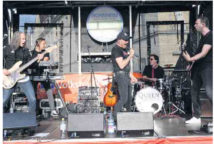
Wie im letzten Jahr ist „Queen May Rock“ der krönende Abschluss von „Bornheim Live!“ am Sonntagabend.