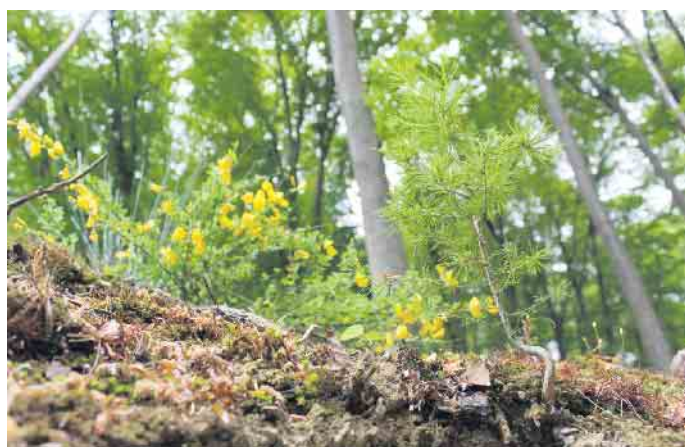
Nachwachsender und klimafreundlicher Rohstoff: Holz speichert während seines Wachstums große Mengen an Kohlendioxid.

In ökologischer Hinsicht weist das Naturmaterial viele Vorteile auf. Einem nachhaltig bewirtschafteten Wald wird nur so viel Holz entnommen, wie wieder nachwachsen kann, ohne die Ressourcen zu erschöpfen. Zudem nehmen Bäume während ihres Wachstums klimaschädliches Kohlendioxid auf und speichern es dauerhaft. Durch eine möglichst lange Nutzung des fertigen Produktes wird dieser positive Effekt verlängert. Aber auch danach lassen sich Holz und Holzreste mehrfach recyceln und zu neuen Produkten verarbeiten. „Das Ziel ist dabei, den Naturrohstoffe so lange wie möglich in der Wertstoff-