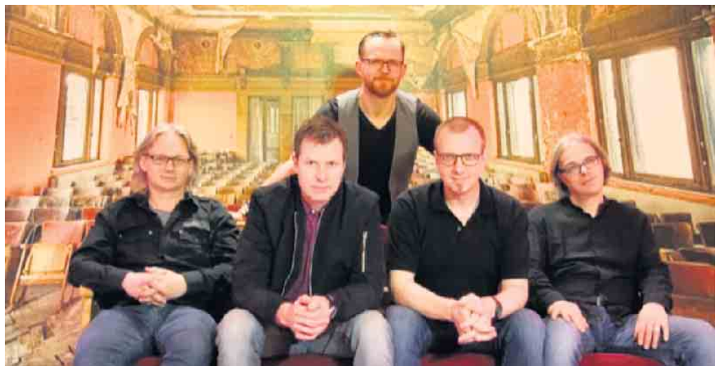
Icon 5, Duo Garage and Friends

Am 19. August steht die schon fast traditionelle „Irish Night“ auf dem Programm. Die Lokalhelden von Duo garage and friends haben sich noch einige Überraschungsgäste eingeladen, um den Vorplatz am Stadion von Rot-Weiß Dünstekoven in einen magischen Ort wie den Ring of Kerry oder die Cliffs of Mo-