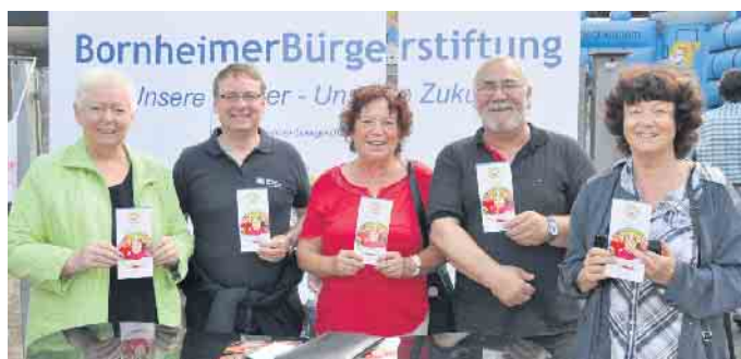
Soziale und karitative Organisationen wie hier die Bornheimer Bürgerstiftung informieren über ihre Anliegen und suchen neue Mitglieder und Förderer.