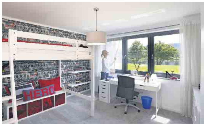
Moderne Fertigg Keller sind darauf ausgelegt, dass sie dem Bauherrn hochwertige Wohnfläche und hohen Wohnkomfort bieten.“

herrn hochwertige Wohnfläche und hohen Wohnkomfort bieten. Richtiges Lüften und Heizen sind dafür wie überall in der Wohnung entscheidend“, schließt Geisser. GÜF/FT