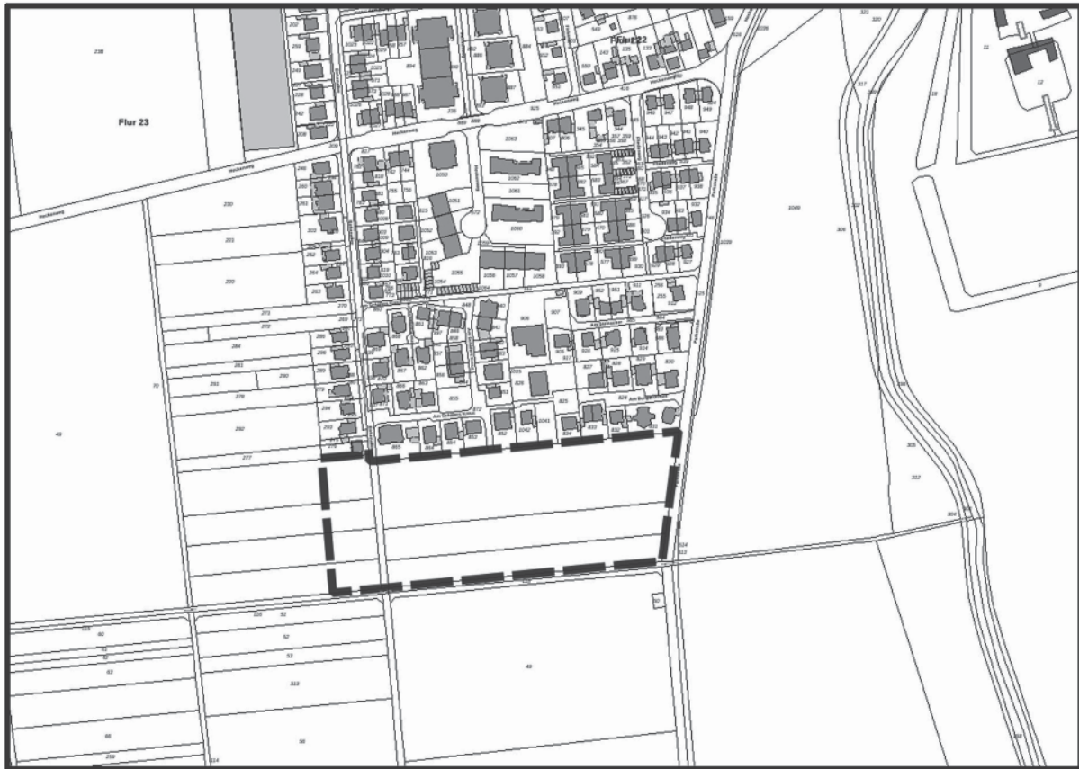
Abbildung: Übersicht des räumlichen Geltungsbereiches der Aufstellung des Bebauungsplanes Heimerzheim Hz 39 „Am Burggraben“

- unmaßstäblich -