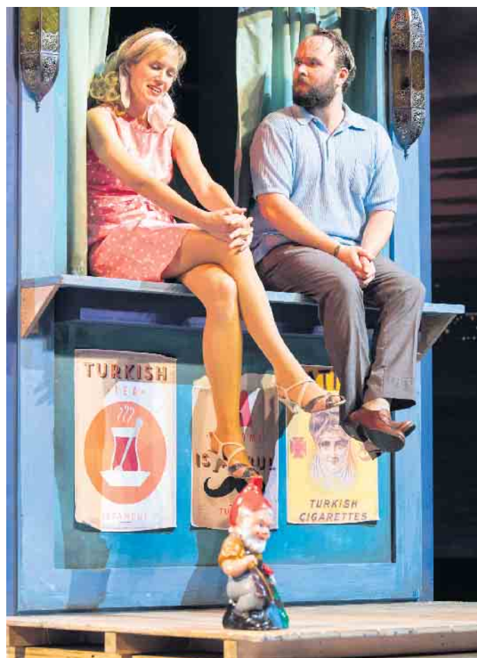
Szene aus „Istanbul“ (Theater Bonn)

Wer also schon immer mal wieder mehr ins Theater gehen wollte, sich aber vor der Autofahrt oder der Anreise mit dem ÖPNV scheut, nicht alleine gehen möchte oder dann doch immer wieder vergisst, die Karten rechtzeitig zu bestellen, findet hier eine Möglichkeit, die bequemer und unkomplizierter nicht sein könnte. Der Bus fährt pünktlich zu den Vorstellungen, direkt vor die Tür der Theater, bei jedem Wetter und niemand fährt allein. Interessierte erfahren mehr bei der Theatergemeinde BONN unter 0228/91 50 30 oder per E-Mail an info@tg-bonn.de . Gerne senden wir Ihnen einen Angebotsflyer zu dem neuen Bus-Abo mit allen Informationen und Preisen zu oder beantworten weitere Fragen.