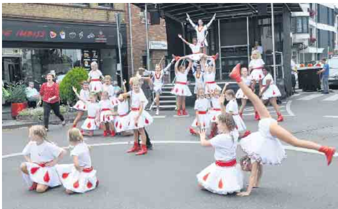
Die Auftritte der örtlichen Vereine sorgen immer wieder für Aha-Erlebnisse bei den Zuschauern.