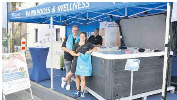
Gerade für junge Unternehmen bietet die Gewerbeschau eine hervorragende Plattform.