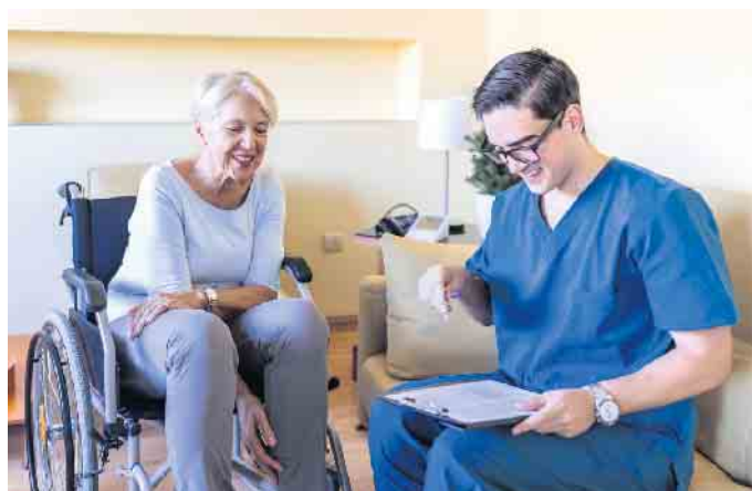
Ein Pflegeberuf bringt viel Kontakt mit anderen Menschen mit sich.

Im Gegensatz zu vielen anderen Berufen ist die Pflege ein Job mit Zukunft. Rund eine Million Menschen werden zurzeit in Pflegeheimen betreut, der Bedarf steigt ständig. Bereits im ersten Lehrjahr erhält ein Azubi 1.200 bis 1.400 Euro brutto. Als fertige Pflegekraft sind es 3.600 bis 4.000 Euro - hinzu kommen Zuschläge