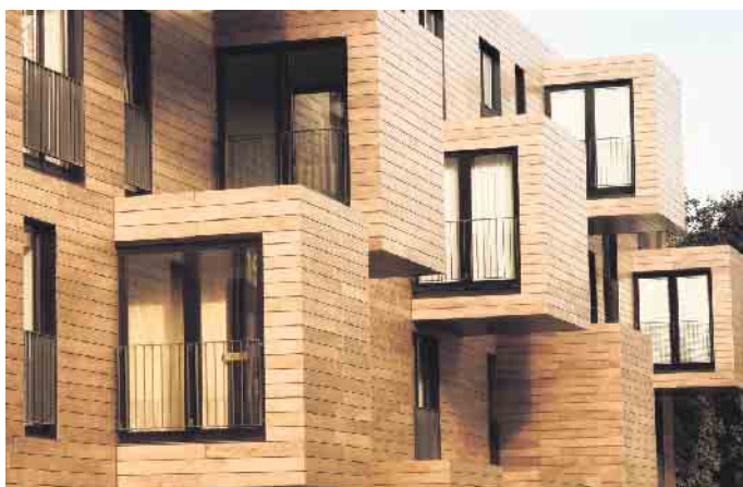
Holz zählt zu den ältesten Baumaterialien, die der Mensch nutzt - und ist unter Aspekten des Klimaschutzes gleichzeitig Rohstoff der Zukunft.