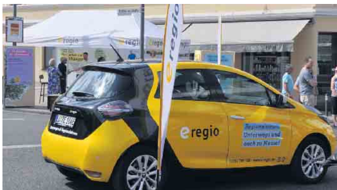
Elektromobilität und Energiesparmaßnahmen nehmen an den Ständen der Autohäuser und Energieunternehmen breiten Raum ein.

Fahrradmobilität oder Bekleidung, Spezialitätengeschäfte oder Fitness- und Wellnessangebote und vieles andere mehr - es ist für jeden Geschmack etwas dabei. Zudem bietet der Verkaufsoffene Sonntag eine besondere Gelegenheit, sich bei den Händlern und Dienstleistern umfassend zu informieren - und das ganz ohne Kaufdruck.