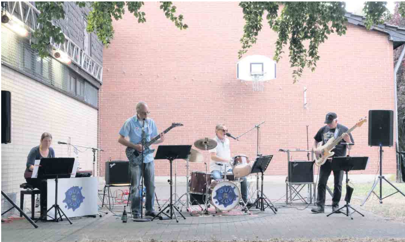
„Out of the Blue“ in Straßfeld