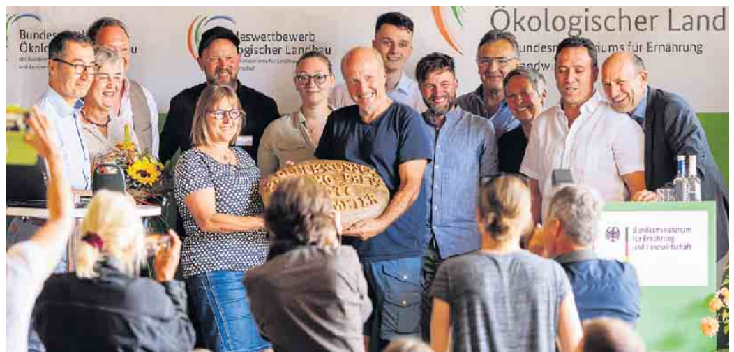
Große Freude herrschte bei der Delegation des Biohof Bursch bei der Preisverleihung.