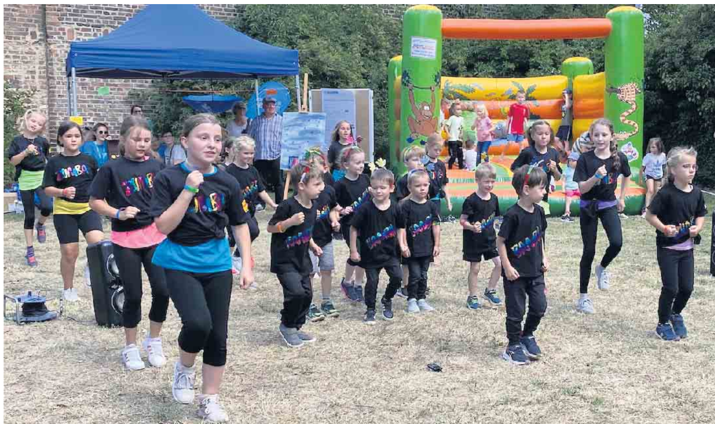
Die Zumba-Kids auf dem Familienfest