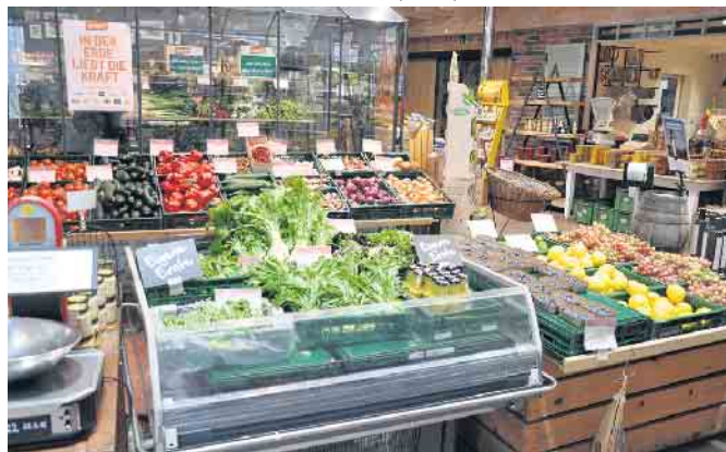
Immer frisch, knackig und schmackhaft - das vielfältige Gemüseangebot in bester Demeter-Qualität.

in den sechziger Jahren begonnen hat und für den er 1994 mit dem Bundesverdienstkreuz ausgezeichnet wurde, richtig und erfolgreich ist und den wir mit viel Elan und Einsatz fortführen werden.“ Deshalb könne auch der Bundeslandwirtschaftsminister bei seiner Initiative, dass bis zum Jahr 2030 30 Prozent der landwirtschaftlichen Fläche ökologisch bewirtschaftet werden, auf die volle Unterstützung des Biohofes Bursch rechnen. (WDK)