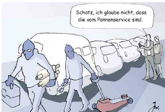
Polizei, Versicherer und Automobilclubs registrieren eine steigende Zahl von Katalysator-Diebstählen.

rufen Werkstätten dafür in der Regel mindestens 500 bis zu über 2.000 Euro auf. Wer über eine Kaskoversicherung verfügt, kann die Kosten, die durch Katalysatordiebstahl entstehen, bei seiner Versicherung geltend machen. Bleibt dann als Eigenbelastung gegebenenfalls nur die Selbstbeteiligung. Allerdings besteht bei älteren Fahrzeugen das Risiko, dass der Aufwand für den Ersatz des Kats den Wert des betroffenen Autos übersteigt. Dann kann sich der Besitzer mit einem Totalschaden konfrontiert sehen. (mid/ak-o)