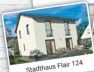
Stadthaus Flair 124