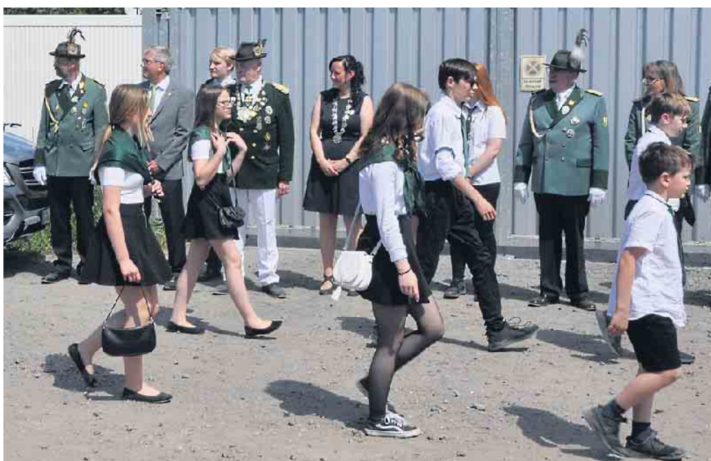
Sehr erfreulich war die Zahl der Nachwuchsschützen, die am Bezirksschützenfest teilnahmen. Im Bild Jugendliche von der Alfterer Bruderschaft