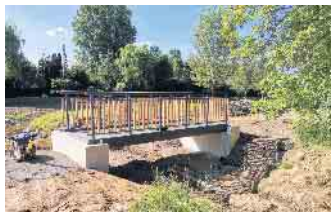
Die neue Brücke am Bächelchen

ler Bürgerhaus wurde am 12.06. die Brücke über das Bächelchen eingesetzt.