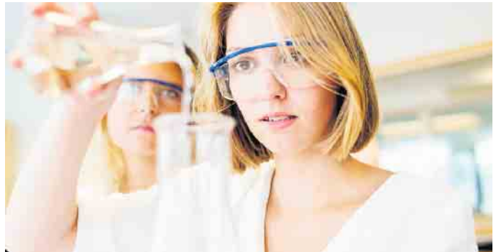
Ausbildungsberufe in der pharmazeutischen Produktion sind oft weniger bekannt, bieten aber gute Perspektiven.

Im Programm „StartPlus“ werden junge Menschen mit Startschwierigkeiten beim Start in eine qualifizierte Ausbildung unterstützt.