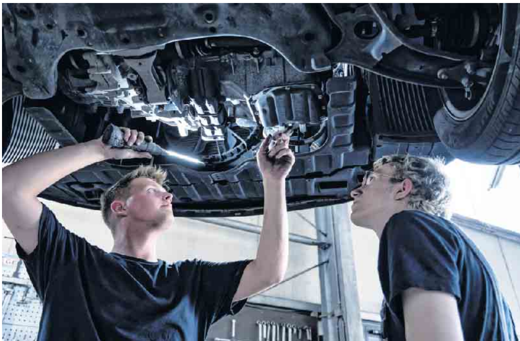
Beim Klimaanlagen-Check prüft der Kfz-Mechaniker alle Teile der Anlage und ihre Funktionen.

Klimaanlagencheck sichert Funktion und vermeidet teure Schäden