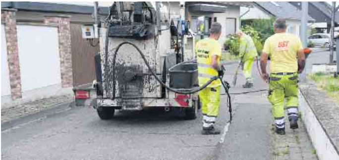
Sanierungsarbeiten in Morenhoven

Swisttal. Im Zuge der regulären Straßenunterhaltung wurde die Firma BST - Beton Sanierung & Trennschnitte, Bad