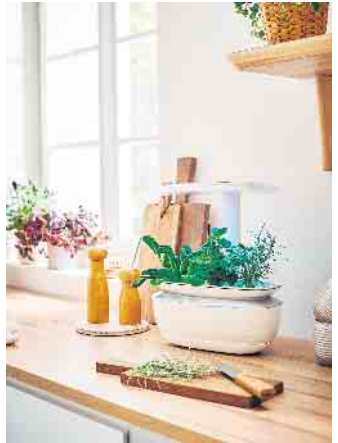
Gesund & frisch ernähren und Indoor-Gardening liegen im Trend. Mit diesem vernetzten Mini-Indoor-Garten lassen sich Kräuter, Salate, essbare Blüten, Microgreens und Früchte das ganze Jahr über superfrisch ernten.