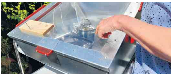
Blick in eine Solarkochbox