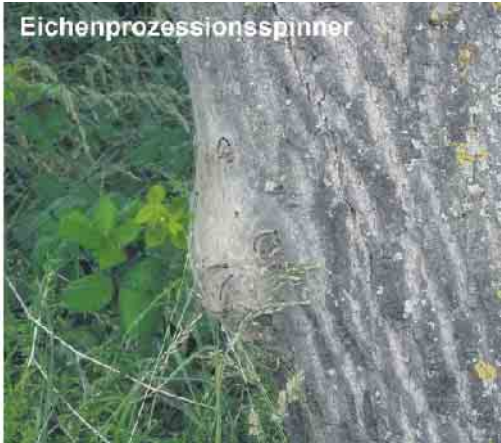
Gespinstmotte / Eichenprozessionsspinner

Kontakt mit den Brennhaaren der Raupen kann es unter Umständen zu allergischen Reaktionen kommen. Auf privaten Grundstücken ist der Grundstückseigentümer für die Entfernung verantwortlich. Die Gemeinde warnt davor, die Nester