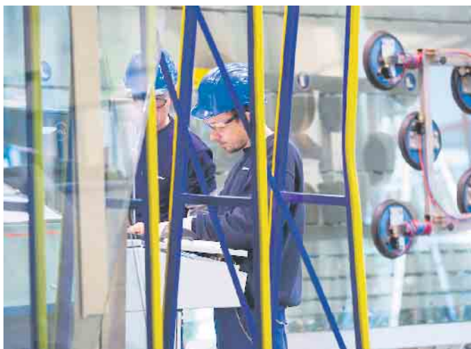
In der Flachglasbranche gibt es spannende Ausbildungsmöglichkeiten.

Hier sind Künstler und Kreative gefragt! Ein Glasveredler beschäftigt sich zum Beispiel mit Glasmalerei. Er oder sie schleift, fräst und sandstrahlt Muster, Ornamente und Dekore und lässt so kleine Kunstwerke entstehen. Diese werden in fast allen Bereichen der Innenarchitektur gebraucht: großformatige Spiegel, kunstvoll gearbeitete Kronleuchter, ästhetische Fenster und Türen. Die duale Ausbildung dauert drei Jahre und erfordert zeichnerisches Talent und räumliches Denkvermögen.