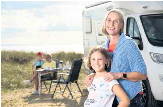
Campingurlaub ist in allen Generationen angesagt. Bevor es losgeht, sollte allerdings der Versicherungsschutz für das Wohnmobil überprüft werden.

Camper werden gerne von Dieben ins Visier genommen. Sperranlagen gibt es in elektronischer Form, etwa Alarmanlagen oder in mechanischer Ausführung, darunter Lenkradkrallen. Der beste Schutz ist die Kombination aus mehreren Sperreinrichtungen. (DJD)