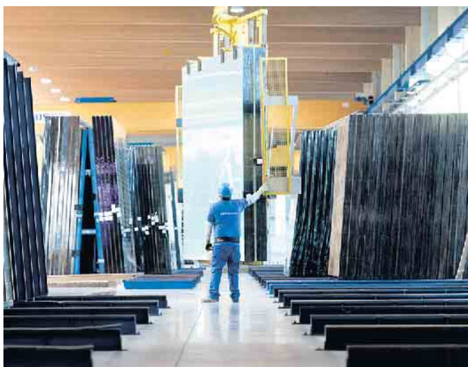
In der Flachglasbranche gibt es spannende Ausbildungsmöglichkeiten.