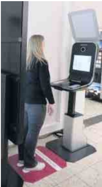
Das neue Speed-Capture-Terminal

Im Rathaus der Gemeinde Swisttal steht nun ein neues Foto-Terminal zur schnelleren Bearbeitung zur Verfügung