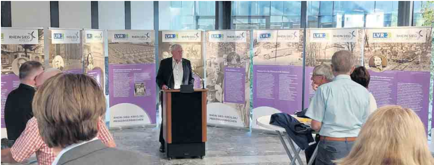
Landrat Sebastian Schuster (am Rednerpult) bei der Eröffnung der Ausstellung.

Eröffnung der Ausstellung durch Landrat Sebastian Schuster