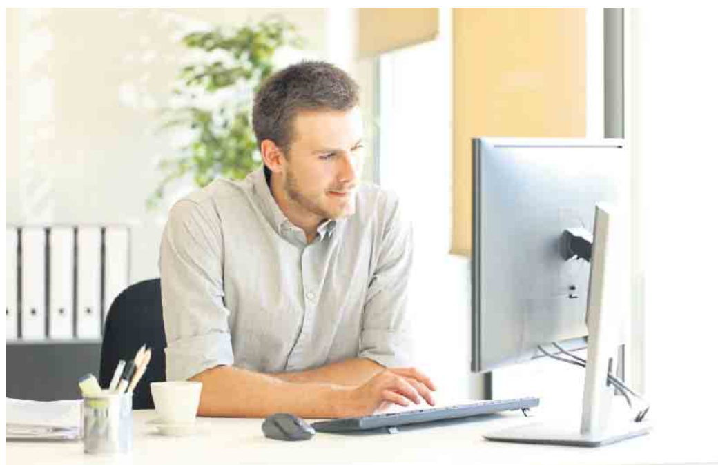
Die fortschreitende Digitalisierung verändert die Anforderungen an die Beschäftigten im Bankwesen rasant.

Die neue Ausbildungsordnung soll nach wie vor fachliche Kompetenzen wie Vermögensbildung, Vorsorge, Kreditgeschäft oder Bau- und Unternehmensfinanzierung vermitteln. Neben vielen digitalen Aspekten werden jetzt aber