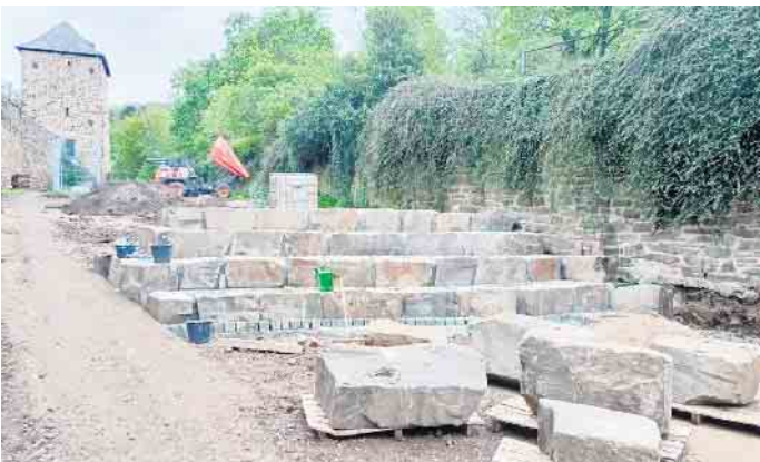
Johanniter-Hochwasserhilfe unterstützt den Bau von Sportanlage und Grünem Klassenzimmer am St. Michael-Gymnasium in Bad Münstereifel.

Die Hilfsangebote der Johanniter sind kostenfrei und werden durch Spenden finanziert.