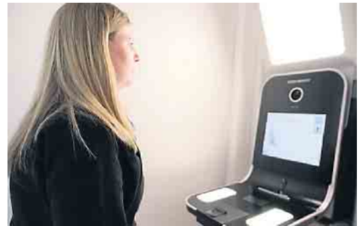
Die Erstellung des Fotos geht nun vollautomatisch

Die Einführung des Terminals soll zu einer Verbesserung der Servicequalität sowie zur Erweiterung des digitalen Angebots des Bürgerbüros dienen. „Mit dem neuen Speed Capture Terminal bieten wir unseren Kunden im Bürgerbüro ein weiteres digitales Serviceangebot. Des Weiteren trägt das Terminal dazu bei, Manipulationen bei der Beantragung von Ausweisdokumenten zu verhindern, da so beispielsweise das