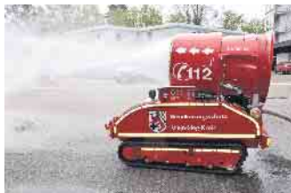
Löschunterstützungsfahrzeug LUF 60 im Einsatz.

Wasser fein zerstäubt; es entsteht eine große Kühlwirkung und dem Brandbereich wird Wärmeenergie entzogen. Mittels des Kettenfahrgestells können Rampen und Treppen überwunden werden. Die Turbine erreicht auch mit über 60 Meter hinweg so hohe Wasserwurfweiten, dass das LUF 60 bei Hallen-, Flächen- und Waldbränden eingesetzt werden kann. Hat die „fahrende Schneekanone“ die erste, grobe Arbeit per Fernsteuerung erledigt, kann die Feuerwehrmannschaft für die weiteren Lösch- oder Bergungsarbeiten