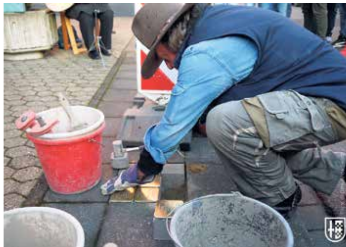
Stolpersteinverlegung durch Gunter Demnig am 19.12.2015 in Swisttal-Heimerzheim

VR-Bank Bonn-Rhein-Sieg eG: DE39 3706 9520 0300 2160 13 KSK Köln: