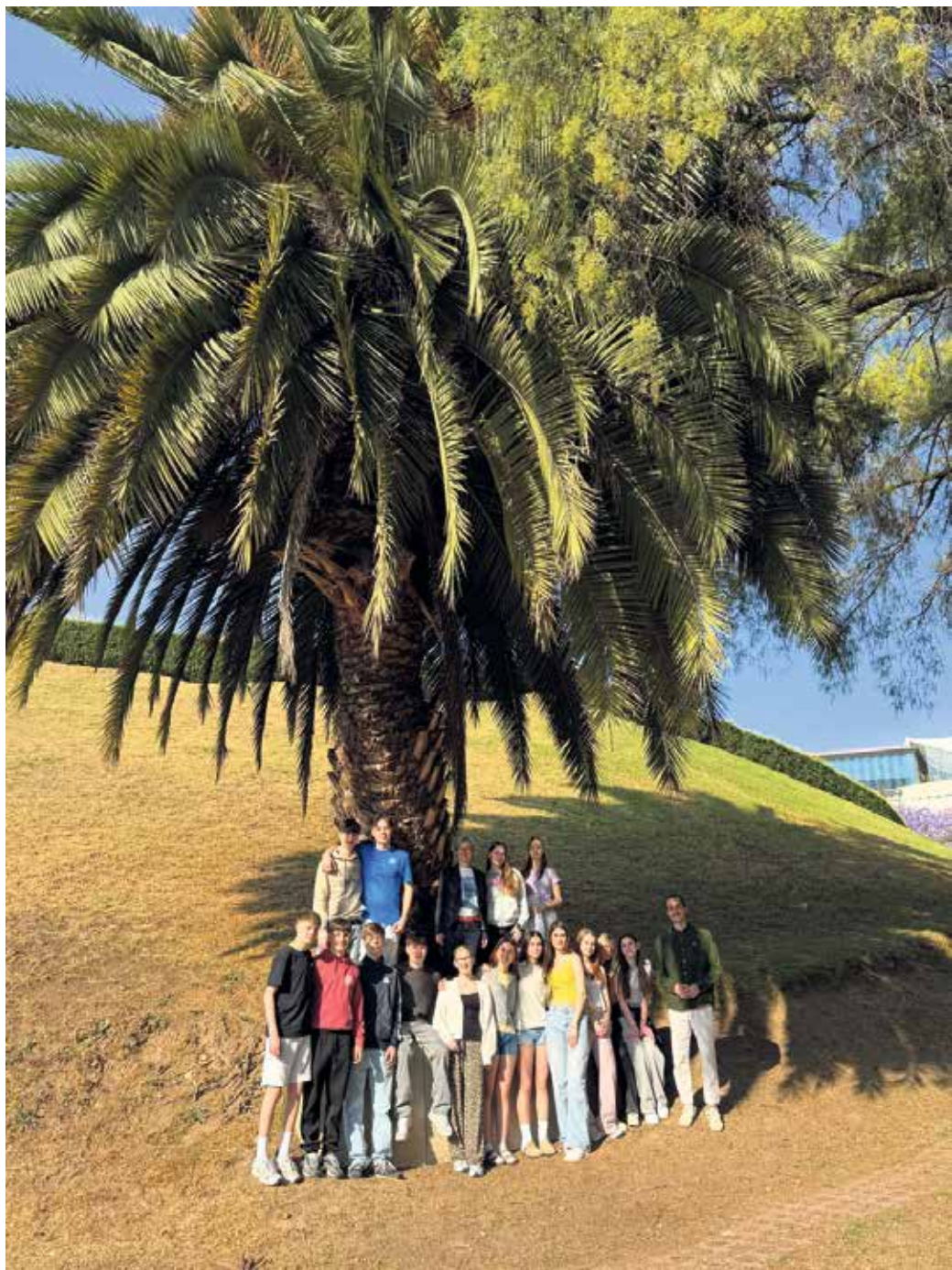
Die Schülerinnen und Schüler der Gesamtschule Swisttal in ihrer Partnerschule Colegio Alemán Alexander von Humboldt in Mexiko-Stadt

Die Partnerschule hat weit bessere räumliche und sächliche Bedingungen, was die Schülergruppe aus Swisttal sehr beeindruckt hat. „Besonders interessant fand ich das Lernzentrum. Die Schule hat einen eigenen Sportplatz, Security am