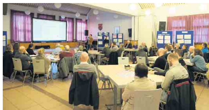
Workshop im Dorfhaus Ludendorf

Ludendorf. Die Gemeinde Swisttal hat sich mit Beschlüssen des Rates vom 24.05.2022 und 21.06.2022 das Ziel gesetzt, bis zum Jahr 2045 klimaneutral zu sein. Zur Erreichung der Klimaneutralität wird gemeinsam mit den Nachbarkommunen der Klimaregion Rhein-Voreifel durch das Institut für angewandtes Stoffstrommanagement (IfaS) ein Interkommunales Klimaneutralitätskonzept erstellt, welches zukünftig als Wegweiser den Kurs in Sachen Klimaschutz vorgibt. Am Donnerstag, den 25. April, fand hierzu ein Auftaktworkshop im Dorfhaus Ludendorf statt.