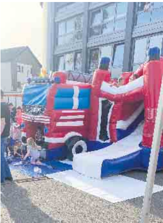
Die kleinen Besucher hatten Spaß auf der Hüpfburg der Feuerwehr.