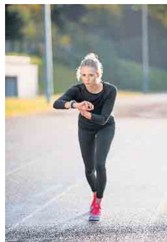
Immer mehr Menschen halten sich mit Sport fit und nutzen dabei auch sogenannte Wearables wie eine Fitnessuhr.

Neben den Leistungen des zweiten Gesundheitsmarktes haben auch digitale Dienste und Apps für das individuelle Training sowie Wearables immer mehr an Bedeutung gewonnen. Aufgaben für Aktivitäten in den Bereichen Sport, Fitness und Gesundheit werden bereits von vielen Krankenkassen erstattet. Der interdisziplinäre Studiengang Bachelor-of-Science Sport-/Gesundheitsinformatik etwa qualifiziert die Absolventinnen und Absolventen, digitale Trainings-, Assistenz- und Datenverarbeitungssysteme speziell für die Sport-, Fitness- und Gesundheitsbranche zu entwickeln. (djd)