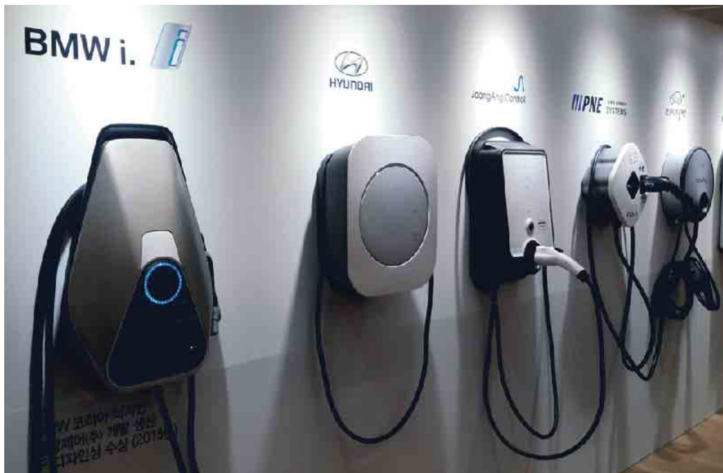
Für Autofahrer ist das Ladeangebot noch recht unübersichtlich.

Der Beschluss bezieht sich lediglich auf neue Autos und kleine Transporter, die ab Januar 2035 zugelassen werden. Diese Neu-Fahrzeuge müssen dann im Betrieb emissionsfrei sein. Alle Fahrzeuge, auch die mit Verbrennungsmotor, die bis Ende 2034 zugelassen werden, dürfen auch weiterhin gefahren werden. Dementsprechend ist auch der Verkauf von gebrauchten Benzinern und Diesel über 2035 hinaus möglich. Die meisten Automobilhersteller haben sich ohnehin bereits zur E-Mobilität bekannt und wollen schon vor 2035 ihr Neuwagenangebot auf batterieelektrische Fahrzeuge umstellen. Nach aktuellem Stand der Technik ist das Null-Emissionen-Ziel nur mit Elektroautos oder wasserstoffbetriebenen Fahrzeugen zu erreichen. Der ACE geht davon aus, dass Wasserstoff aufgrund kurzer Betankungszeiten, großer Reichweiten und weltweit einheitlichen Tank-systemen in Zukunft im Schwerlast-