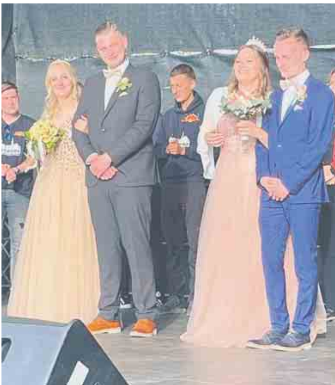
Maigrafen- und Maikönigspaar

ken! Wir freuen uns auf Euer zahlreiches Erscheinen und auf ein gutes Fest! Falls sich hier jemand angesprochen fühlt -egal ob jung oder alt - egal welches Instrument - der Tambourcorps probt jeden Montag im Dorfsaal Odendorf ab 19.30 Uhr oder einfach eine E-Mail an tombourcorps-loreley@web.de mit euren Kontaktdaten. Wir freuen uns über jedes Interesse und neues Mitglied.