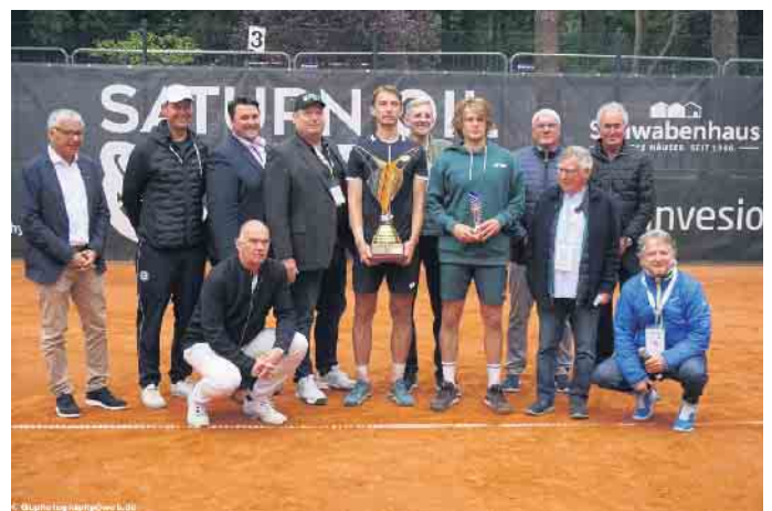
Veranstalter, Organisatoren, Publikum und Tennis-Profis freuen sich auf die 2. Auflage der Saturn Oil Open.