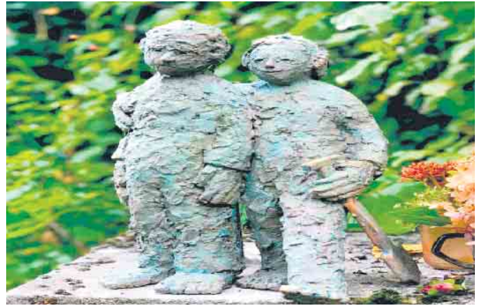
3. Platz - „Figuren auf Sockel“

insgesamt 15 Entwürfe zur Errichtung eines Denkmals eingegangen. Die eingegangenen Entwürfe wurden im Flur des Rathauses ausgestellt. Weitere Informationen zu den Entwürfen haben sich auf der Homepage der Gemeinde befunden. Die Entwürfe wurden im Amtsblatt der Gemeinde ebenfalls vorgestellt.