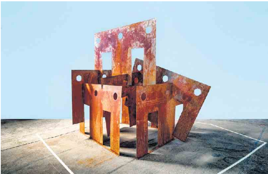
1. Platz - „Einblicke - Durchblicke“

Swisttal. Zum Gedenken an die Flutkatastrophe am 14. und 15. Juli 2021 wurde der Arbeitskreis „Jahrestag Flutkatastrophe“ gegründet. Der Arbeitskreis besteht aus Vertretern jeder im Rat der Gemeinde Swisttal vertretenen Fraktionen sowie der Bürgermeisterin. Der Arbeitskreis „Jahrestag Flutkatastrophe“ hat in seinen Sitzungen beschlossen, zu einem Wettbewerb zur Errichtung eines „Denkmals der Erinnerung an die Flutkatastrophe 2021“ aufzurufen, um die Erinnerung an diese Flutkatastrophe wach zu halten und einen Ort des Gedenkens zu schaffen. Dabei sollten die Entwürfe einen Bezug zu der Flutkatastrophe herstellen sowie zum Verweilen und Nachdenken anregen. Dabei sind bei der Gemeinde bis zum Einsendeschluss