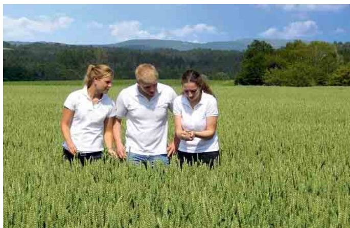
Genauere Kenntnisse über das Naturprodukt Getreide gehören zu den Grundlagen des Müllerberufs.

Nach erfolgreicher Gesellenprüfung sind die Chancen auf einen sicheren Arbeitsplatz und gute Bezahlung hoch. Zudem stehen Müllern und Müllerinnen zahlreiche Karriereoptionen offen. So kann man die Meisterschule besuchen und einen Abschluss als Müllermeister machen oder an der Technikerschule in Braunschweig innerhalb von zwei Jahren die Titel „Meister“ und „staatlich geprüfter Mülletechniker“ erwerben. Als letzter Schritt lässt sich ein betriebswirtschaftliches Studium draufpacken, das fit macht für alles rund um Finanzen, Marketing und Personalwesen. Zudem ermöglicht der Meisterbrief das (Fach-)Hochschulstudium in vielen technischen und ernährungswirtschaftlichen Fächern. (djd)