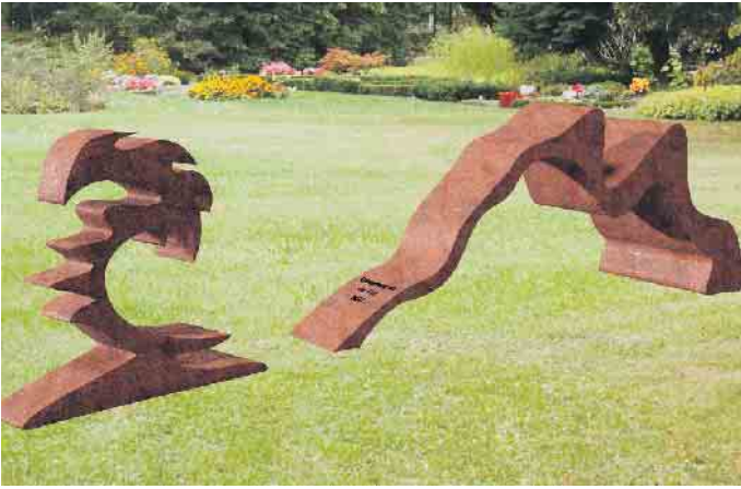
2. Platz - „Wave“