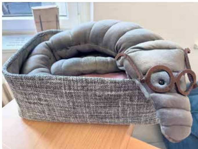
Kuno, der Bücherwurm