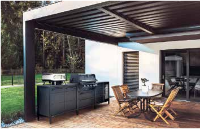
Geselliges Kochen im Freien: Die einzelnen Module lassen sich individuell zu einer komfortablen Outdoorküche kombinieren.

Runde Säulentische, bequem gepolsterte Stühle mit Kordelbespannung und individuell planbare Outdoorküchen prägen die neue Außensaison