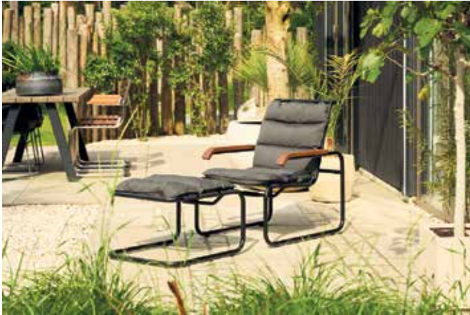
Freiluftvariante eines Klassikers: Der frei schwingende Stahlrohrsessel wird für zusätzlichen Komfort mit einem passenden Fußhocker ergänzt.

Bei den Materialien reicht die Auswahl etwa von gebürstetem Edelstahl über recyceltes Teakholz bis hin zu Keramik, Naturstein und modernen Verbundwerkstoffen. Verband der Deutschen Möbelindustrie e.V. Bad Honnef