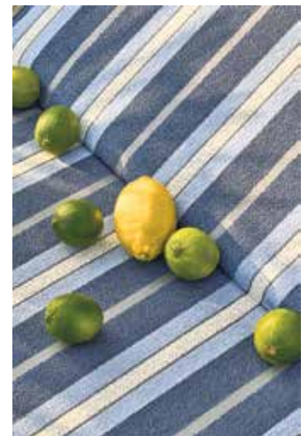
Der weiche Outdoor-Bouclébezugsstoff mit der markanten Blockstreifenoptik ist lichteht, waschbar und trocknet schnell ab.

Outdoorküchen stehen für Geselligkeit und Genuss im Freien. Die einzelnen Module lassen sich individuell kombinieren und den jeweiligen Gegebenheiten anpassen. Zur Standardausstattung gehören meist ein Gas- oder Holzkohlegrill, ein Spülbecken, ein Kühlschrank so-