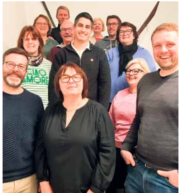
Der neu zusammengesetzte Vorstand