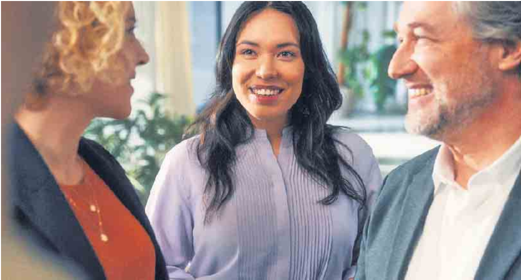
Eine positive Arbeitsatmosphäre ist ein wichtiger Faktor, um Fachkräfte dauerhaft an das Unternehmen zu binden.