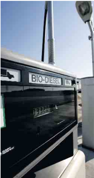
Diesel und Benzin mit höheren Biokraftstoffanteilen können einen wichtigen Beitrag zur Senkung der CO2-Emissionen bei Fahrzeugen mit Verbrennungsmotor leisten.

Gegenüber Benzin und Diesel aus fossilen Rohstoffen entlasten Biokraftstoffe das Klima durch im Schnitt 87 Prozent geringere CO2-Emissionen. Wichtigste Quelle für Biodiesel ist Raps - im Jahr 2024 fuhr Deutschland laut EU-Kommission die größte Rapsernte aller europäischen Länder ein. Die weithin sichtbar gelb blühenden Rapsfelder liefern nicht nur Öl für die Kraftstoffherstellung, sondern leisten auch einen Beitrag zur Nahrungsmittelversorgung. Denn der größere Teil der Ernte wird