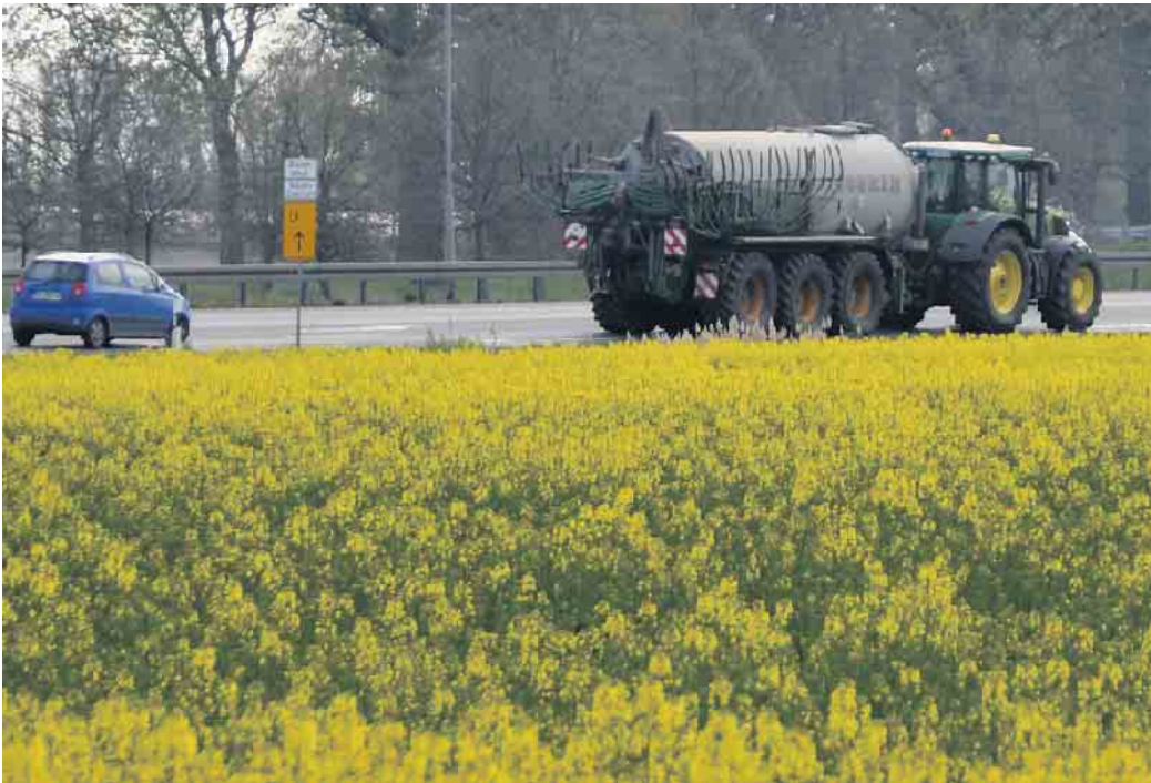
Aktuelle Statistiken zeigen, dass Fahrzeuge mit Verbrennungsmotor unser Straßenbild noch für geraume Zeit bestimmen werden. Es lohnt sich daher, klimafreundliche Biokraftstoff-Alternativen zum Beispiel von deutschen Rapsfeldern im Fokus zu behalten.