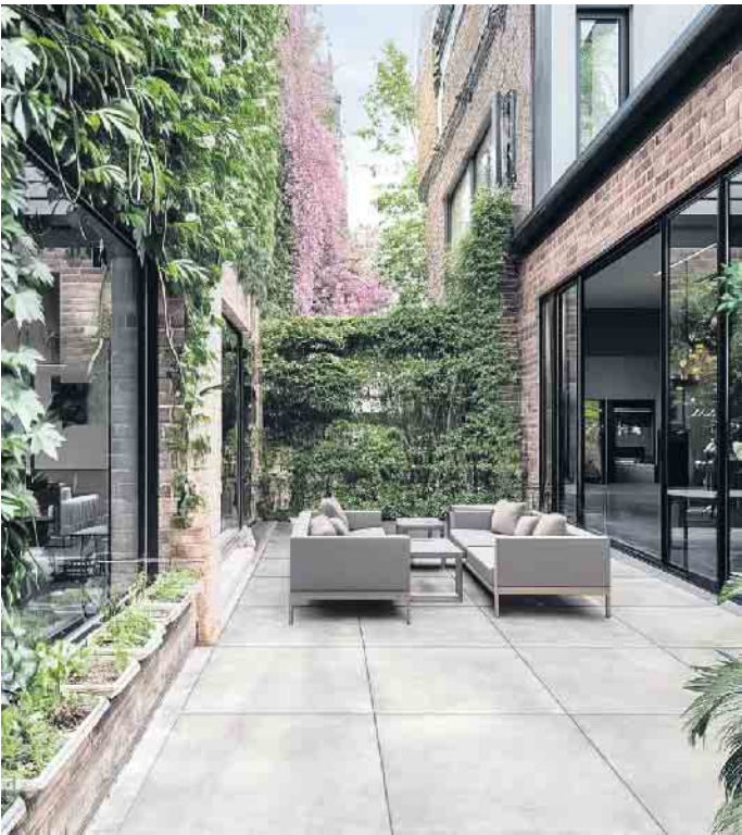
Verleihen dem Außenbereich urbanen Chic: PUREA®-Platten im Format 90x90 cm in Concrete Grey

mieren das Fugenbild - ideal für eine großzügige Terrassengestaltung. Schöne Lösungen für Terrasse und Einfahrt sind zu entdecken im Ideengarten in der Maarstr. 85 in Bonn-Beuel. Mehr Informationen unter www.koll-steine.de . CSH