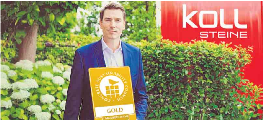
Ausgezeichnet für verantwortungsbewusste Produktion: KOLL Steine erhält Gold-Zertifikat

KOLL Steine setzt Maßstäbe in nachhaltiger Betonsteinherstellung: Das Werk in Bonn wurde mit dem Gold-Zertifikat des Concrete Sustainability Councils (CSC) ausgezeichnet - ein Beleg für verantwortungsbewusste Produktion. Durch den Einsatz von Sekundärmaterialien, erneuerbare Energien wie Solarstrom und gezielte Energieeinsparmaßnahmen senkt das Unternehmen seinen CO 2 -Fußabdruck nachhaltig. Verbleibende Emissionen werden kompensiert - ein wichtiger Schritt Richtung Klimaneutralität.