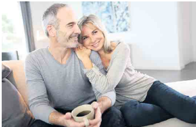
Eine Lüftungsanlage bietet mehr Lebensqualität. Die Räume werden kontinuierlich mit Außenluft versorgt, Feinstaub und Pollen werden dabei zuverlässig abgefangen.

denn den Großteil unserer Lebenszeit halten wir uns in Innenräumen auf. Um eine gesunde Raumluftqualität sicherzustellen, ist regelmäßiges Lüften daher enorm wichtig. Saubere Luft zum Atmen Mit der manuellen Fensterlüftung