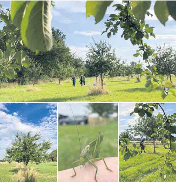
Arbeiten auf der Wiese.

Aktuell sind wir noch ein kleiner Verein und würden uns sehr über neue Mitglieder freuen, die unsere Begeisterung für die Natur teilen. Ob Baumpflege, Wiesenpflege oder einfach nur das gemeinsame Arbeiten an der frischen Luft - bei uns gibt es immer etwas zu tun. Besonders freuen wir uns, wenn auch Familien mit Kindern Teil unserer Gemeinschaft werden. Kinder finden bei uns viele Möglichkeiten, die Natur hautnah zu erleben und sich sinnvoll zu beschäftigen. Sie lieben die Natur und möchten sich aktiv einbringen? Dann kommen Sie einfach vorbei und werden Sie Mitglied! Wir freuen uns auf Sie. Mehr Informationen gibt es auf unserer Homepage: www.streuobst-swisttal.de dort findet Sie auch immer die aktuellsten Termine.