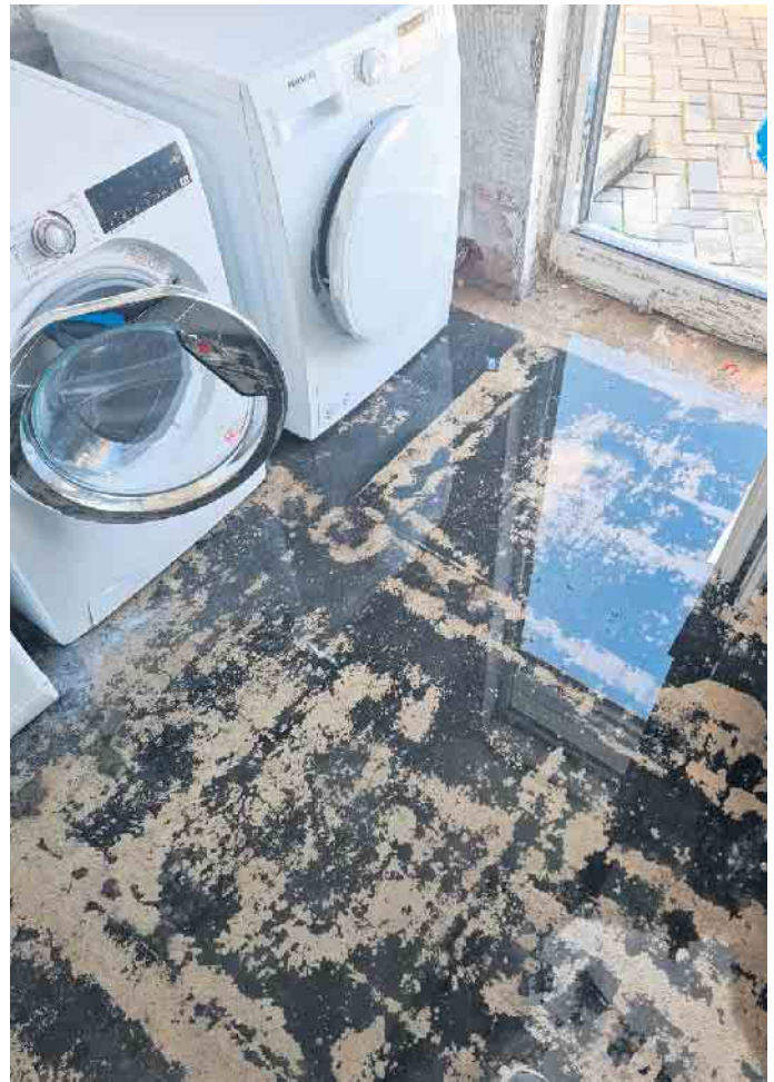
Das Wasser stand in den Räumen bis zu 5 cm hoch

Der SV Swisttal und der SV Hertha haben bei der Polizei Strafanzeige gestellt. Für die ehrenamtlich tätigen Vereinsverantwortlichen aus Morenhoven und Buschhoven hat der neuerliche Vandalismus-Fall enormen zusätzlichen und frustrierenden Zeitaufwand zur Folge. Für die Vereine stellt die Beseitigung der Schäden und die Neubeschaffung des zerstörten Inventars zudem einen zusätzlichen finanziellen Aufwand dar. Jetzt sind die Vereine auf Mithilfe angewiesen: Wer kann Hinweise auf verdächtige Feststellungen oder den/die Verursacher geben? Auch Hinweise zu der Jugendgruppe, die sich am Sonntagnachmittag (2. April) auf der Sportanlage aufgehalten hat, können weiterhelfen. Hinweise, selbstverständlich auch anonym, nehmen die Vereine (schaden-hertha@gmx.de) oder die Polizei (Poststelle.Bonn@polizei.nrw.de) entgegen.