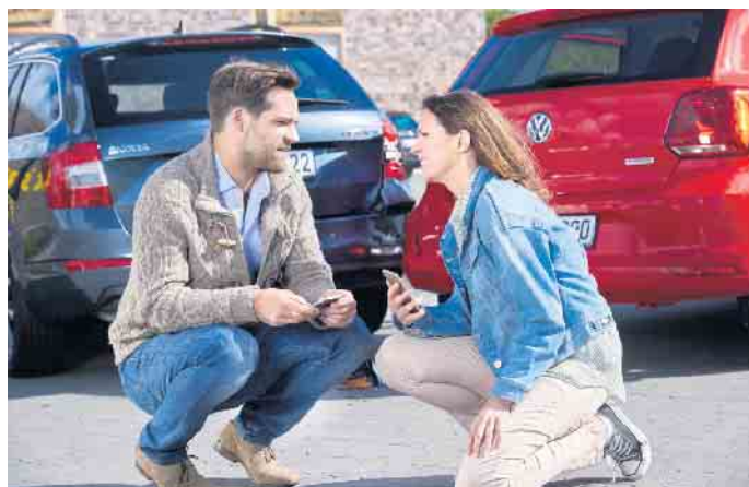
Auch bei einem Sachschaden müssen die Unfallbeteiligten einen kühlen Kopf bewahren und richtig handeln.

Im vergangenen Jahr hat die Polizei in Deutschland nach Angaben des Statistischen Bundesamtes rund 2,3 Millionen Unfälle aufgenommen, drei Prozent mehr als im Jahr zuvor. Die Zahl der Unfälle, bei denen Menschen verletzt oder getötet wurden, ging dagegen um etwa zwei Prozent auf rund 258.000 zurück. 2.569 Menschen kamen im Straßenverkehr ums Leben - der niedrigste Wert seit Beginn der Statistik vor mehr als 60 Jahren. Doch wie verhält