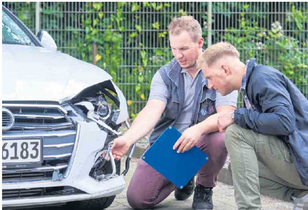
Beim Großteil der Unfälle bleibt es zum Glück bei Sachschäden.

man sich richtig, wenn man in einen Crash verwickelt wird?