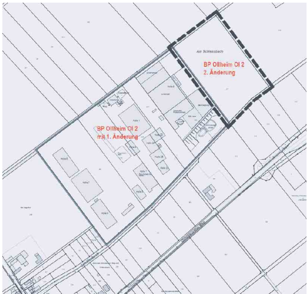
Übersicht zum räumlichen Geltungsbereich des Bebauungsplanes Ollheim Ol 2 „Gewerbegebiet Am Schießbach“, 2. Änderung und Erweiterung © Amt für Katasterwesen und Geoinformation des Rhein-Sieg-Kreises (genordet, ohne Maßstab)

Diese Bekanntmachung ist im Internet auf der Homepage der Gemeinde Swisttal unter der Adresse http://www.Swisttal.de (Menüpfad: Gemeinde, Rat, Verwaltung >> Bürgerservice >> Amtliche Bekanntmachungen ) abrufbar.