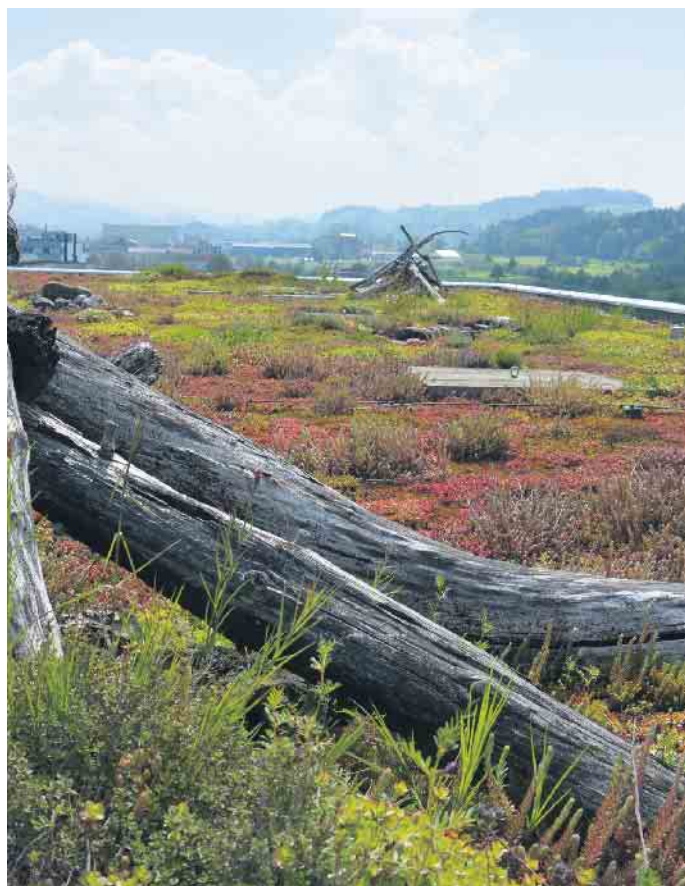
Die Begrünung von Flachdächern trägt zu einem besseren Mikroklima bei.