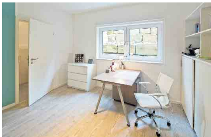
„Wohnkeller stehen oberirdischen Räumen heute in puncto Wohnkomfort in nichts mehr nach“.

genden Stockwerke und schafft willkommene Platzreserven, beispielsweise für ein Kinderspielzimmer oder für ein räumlich abgetrenntes Arbeitszimmer. „Wohnkeller stehen oberirdischen Räumen heute in puncto Wohnkomfort in nichts mehr nach: Frischluft, Tageslicht, behagliche Wärme und Deckenhöhe - für alles gibt es effiziente Lösungen“, weiß die Expertin Birgit Scheer vom GÜF-Mitgliedsunternehmen MB Effizienzkeller.