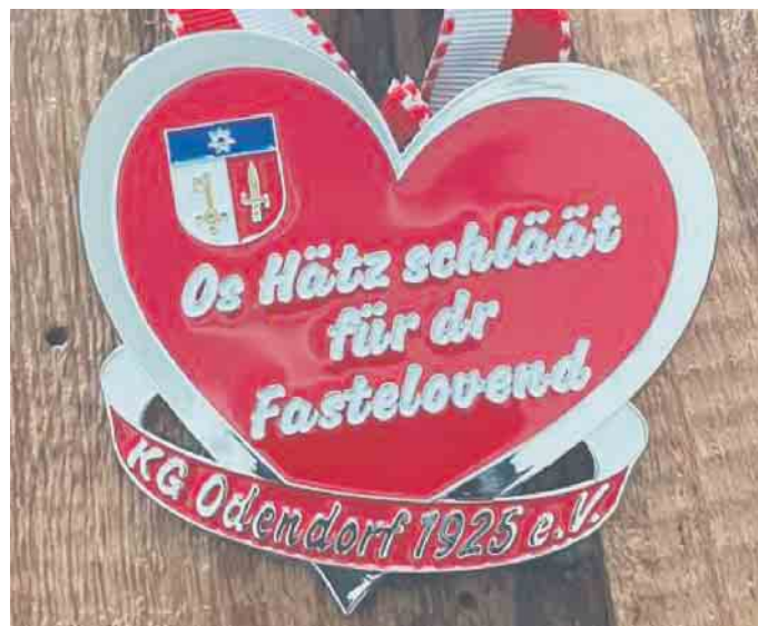
Karnevalsorden für die Session 2022/2023 der KG Odendorf.

Nach einer solch gelungenen Session ist es Zeit, „Danke“ zu sagen. Der KGVorstand bedankt sich herzlich bei allen, die ihn in der zurückliegenden Session unterstützt und begleitet haben. Ob nun mit Sponsoring, Fahrzeugen, haupt- und ehrenamtlichem Engagement oder mit Rat und Tat: Ohne Sie und Euch wäre es nicht so schön gewesen. Danke vielmals!