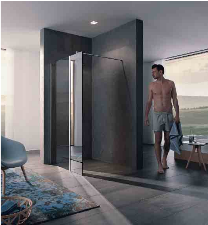
Transparente und teilverspiegelte Trennwände bei der Dusche bringen ein Gefühl von Weite - auch in kleine Bäder.