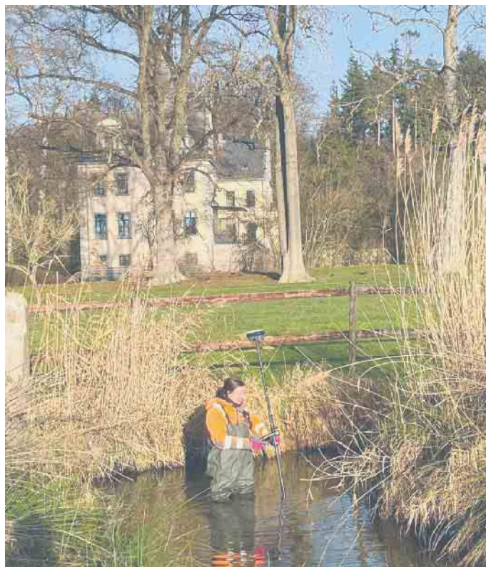
Vermessungsarbeiten in Swisttal durch das Vermessungsbüro Ludwig und Wettengel