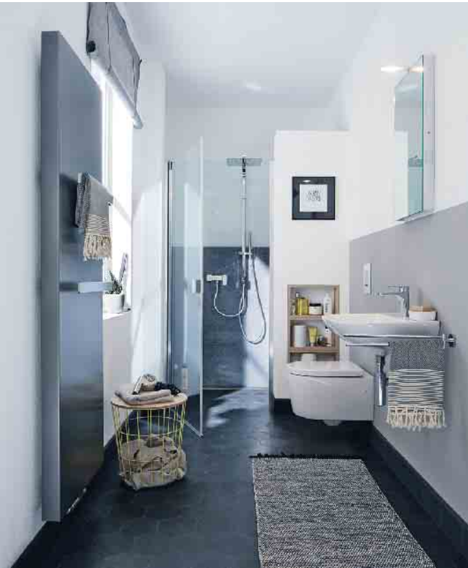
Kermi zeigt mit der Duschabtrennung Raya, wie sich Wandelemente und transparente Duschtüren zu komfortablen Lösungen kombinieren lassen, die auch in kleinen oder schmalen Räumen perfekt funktionieren.

Drehtüren fällt, hängt ganz von den räumlichen Gegebenheiten und den persönlichen Vorlieben ab. Aber auch eine abgeschlossene Kabine kann ausgesprochen transparent wirken, wenn eine rahmenlose oder teilgerahmte Beschlag-Duschkabine gewählt wird. Wie auch immer: Hauptsache, die Dusche bietet kein Hindernis für grenzenlosen Durchblick. (akz-o)