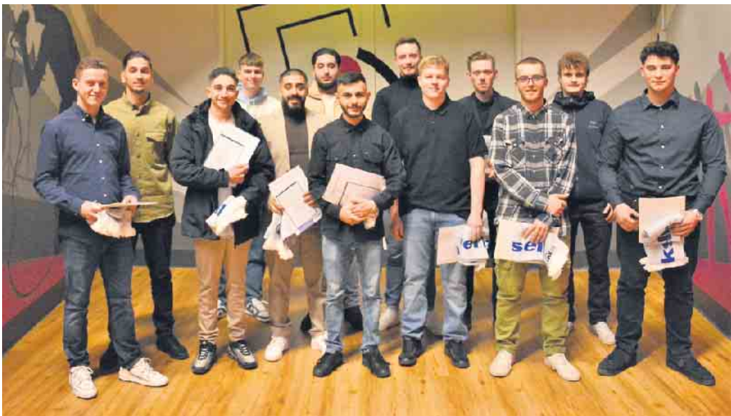
Zu Recht stolz: 12 von 120 Gesellen bei der Lossprechung