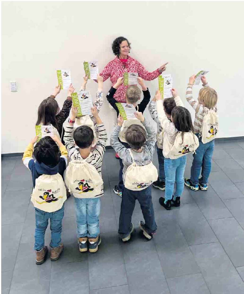
Abschluss Bibfit Katholischer Kindertagesstätte

Vorschulkinder der Odendorfer Kindergärten werden bibliotheksfit