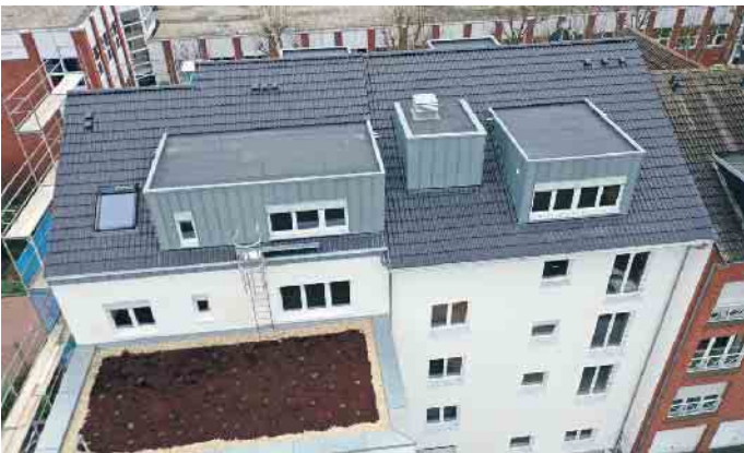
Dachdecker lassen Dächer auch ergünen.