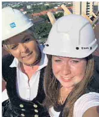
Klimaschutz, keine reine Männersache; es gibt auch Frauen im Dachdeckerhandwerk.

Schallschutz. Junge Leute, die gerne im Handwerk arbeiten und dabei auch Klimaschützer sein wollen, liegen mit einer Ausbildung im Dachdeckerhandwerk genau richtig“, rät ZVDH-Präsident Dirk Bollwerk und ergänzt, dass das Dachdeckerhandwerk bislang auch gut durch die Coronakrise gekommen sei: kaum Kurzarbeit und wenige Entlassungen. Auch dies ein Pluspunkt, der für eine Dachdecker-Ausbildung spricht: Dachdecker sind immer gefragt. Mehr Infos unter www.dachdeckerdeinberuf.de (akz-o)