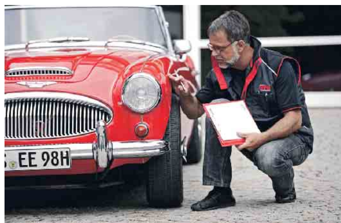
Vor der Erteilung eines H-Kennzeichens muss erst ein Ingenieur das Auto überprüfen und die Originalität beurteilen.

auch ein H-Kennzeichen. Die meisten Oldtimer mit H-Zulassung tragen einen Mercedes-Stern (158.843), gefolgt von VW (125.438). Dahinter folgen mit deutlich niedrigeren Werten die Hersteller Porsche (43.261), BMW (37.006) und Opel (27.370). (mid/ak-o)