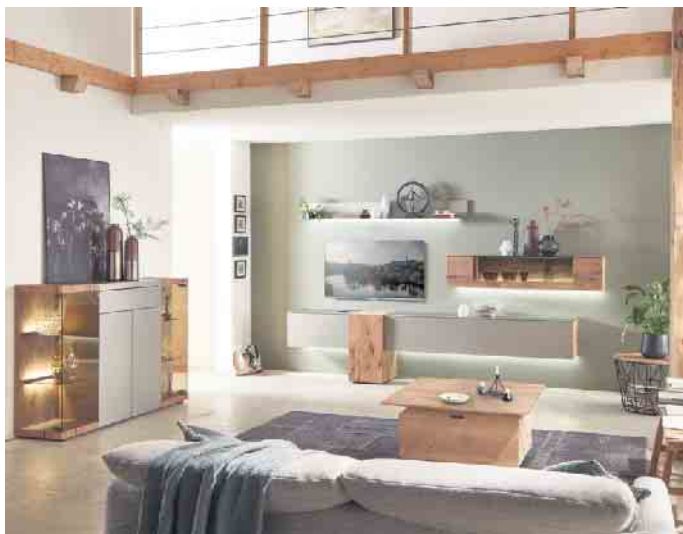
Wer klimafreundlich einrichten möchte, sollte beim Möbelkauf genau hinschauen.

Die bewusste Materialauswahl der Möbelhersteller mit dem „Goldenen M“ macht es Endverbrauchern beim Möbelkauf