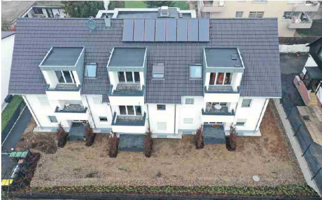
Das Dachdeckerhandwerk, der richtige Ansprechpartner für die Solaranlage auf dem Dach.

Im Bereich Gebäudesektor liegt Deutschland im Vergleich mit den zwanzig wichtigsten Industrie- und Schwellenländern bei der Energieeffizienz im Neubau vorne. Die weniger gute Nachricht ist die schleppende energetische Sanierung bei älteren Gebäuden. Einer der Gründe sind unzureichende Renovierungsraten. Angestrebt müsse mindestens eine Verdoppelung der derzeitigen Rate, die aktuell bei 1 % liegt. Besser noch wäre nach Meinung der Klimaexperten eine Rate von 3,5 %. Hier kommt das Dachdeckerhandwerk ins Spiel: Sie führen geeignete Maßnahmen wie Wärmedämmung an Wänden, am Dach oder an der oberen Geschossdecke aus, durch die schon viel Energie eingespart werden kann. Dachdecker und Dachdeckerinnen sind wichtige Berater, wenn es darum geht, welche Maßnahmen sinnvoll sind, aber auch, welche Fördergelder infrage kommen. Zum Beispiel lassen sich durch Kredite bei der KfW oder der Nutzung von Steuerermäßigungen für energetische Sanierungen auch im privaten Wohnungsbau deutliche Einspareffekte erzielen. „Dachdecker sind daher ganz wichtige Akteure, wenn es um das Erreichen der Klimaschutzziele geht, denn sie sind Spezialisten, die die notwendigen Sanierungs-Maßnahmen im Gebäudebestand planen und durchführen“, erläutert Claudia Büttner, Pressesprecherin beim Zentralverband des Deutschen Dachdeckerhandwerks (ZVDH). Dachdecker sind Klimaschützer Zunehmend wird es auch wichtig, den bereits deutlich spürbaren