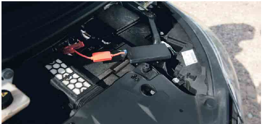
Akku-Booster in Aktion: Rote Polklemme an Plus, schwarze Polklemme an Minus, dann fließt der Strom.

Fast jeder Autofahrer kennt das Problem: Niedrige Temperaturen reduzieren die Leistungsfähigkeit von Batterien enorm. „Starthilfe-Booster“, eine Art Powerbank für Autos, können als kurzfristige Ersatzbatterie einspringen und das Anlassen des Motors ermöglichen. Der Booster läuft mit zwölf Volt und kann mit Polklemmen an die schlappe Batterie des Autos angeschlossen werden, heißt es beim Automobilclub ACE. Dazu die rote Polklemme an Plus anklammern, die schwarze Polklemme an Minus und prüfen, ob die Klemmen richtig sitzen. Fünf Minuten warten und den Motor starten. Sobald der Motor läuft, den Booster so schnell wie möglich abklemmen. Das Starthilfegerät sollte unbedingt über einen Schutz vor Kurzschlüssen verfügen. Damit wird Schlimmeres verhindert, wenn sich beide Polzangen bei eingeschaltetem Booster berühren.