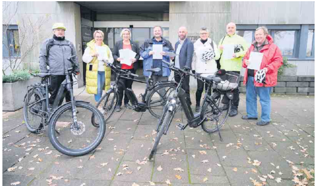
Stadtradeln 2022 - Ehrung der Radlerinnen und Radler

Aus Swisttal nahmen insgesamt 46 Radelnde teil, aufgeteilt auf neun Teams aus nahezu allen Ortsteilen. Die Swisttaler Stadtradler kamen auf stolze 9.054 Kilometer und eine Tonne CO 2 -Einsparung. Im Rhein-Sieg-Kreis wurden