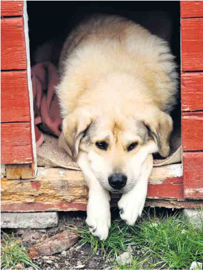
Auch Herdenschutzhund Aldrin wird von der Spende profitieren.