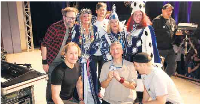
Die drei Engel für Bielstein und Kasalla