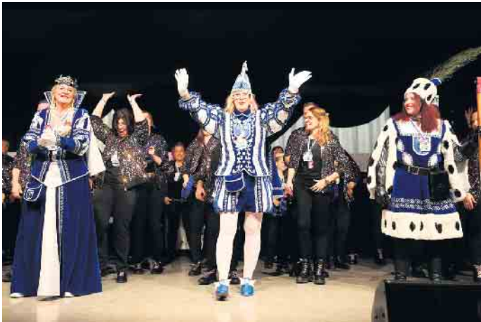
Das Bielsteiner Dreigestirn

Damen-Dreigestirn übernimmt zur 40. Jubiläumssession