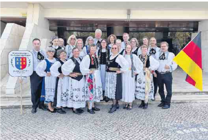
Die 22 Tänzerinnen und Tänzer versammelten sich vor dem Rathaus in Albufeira zum Gruppenbild.

Die Siebenbürger Volkstanzgruppe Drabenderhöhe hat bei einem Festival in Portugal das Publikum begeistert. Von dort brachte das Ensemble nicht nur einen Pokal mit, sondern auch Geschenke für den Bürgermeister.